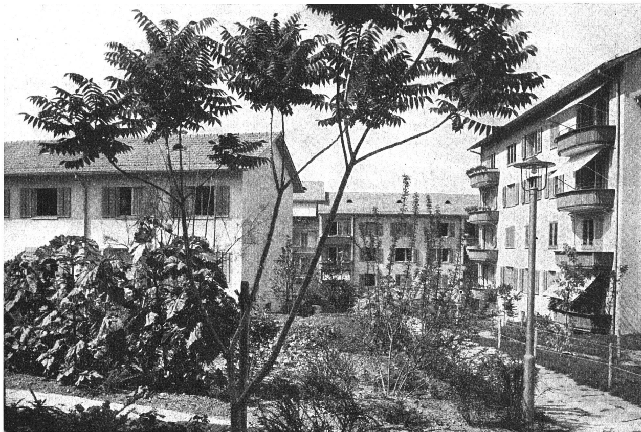
Blick in die 15. Etappe Schweigmatt, erbaut 1948

Unsern Dank für das Geschaffene und die große gemeinnützige Arbeit wollen wir mit unserem Willen zur Zusammengehörigkeit kundtun. Sg.