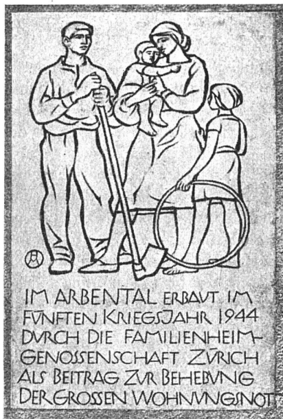
Hausspruch im Arbenal

Die innerlich erstarkte Genossenschaft unter der fürsorglichen Leitung ihres Präsidenten befaßte sich mit Aufgaben der Freizeitgestaltung sowohl der Jugend wie der älteren Semester. In der Grünanlage Bachtobel erstet eine Bocciabahn, die in den kommenden Jahren zum Spiel- und Erholungsplatz der alten Gardé wird. Die Jugend feiert ihre eigenen Feste, Räbeliechtli-Umzüge, Samichlaus und Jahresschlußfeiern. Tausende