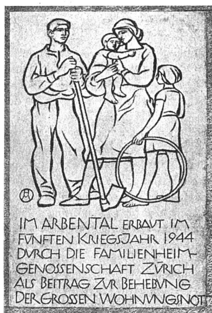
Hausspruch im Arbental

Die innerlich erstarkte Genossenschaft unter der fürsorglichen Leitung ihres Präsidenten befaßte sich mit Aufgaben der Freizeitgestaltung sowohl der Jugend wie der älteren Semester. In der Grünanlage Bachtobel erstet eine Bocciabahn, die in den kommenden Jahren zum Spiel- und Erholungsplatz der alten Garde wird. Die Jugend feiert ihre eigenen Feste, Räbeliechtli-Umzüge, Samichlaus und Jahresschlußfeiern. Tausende