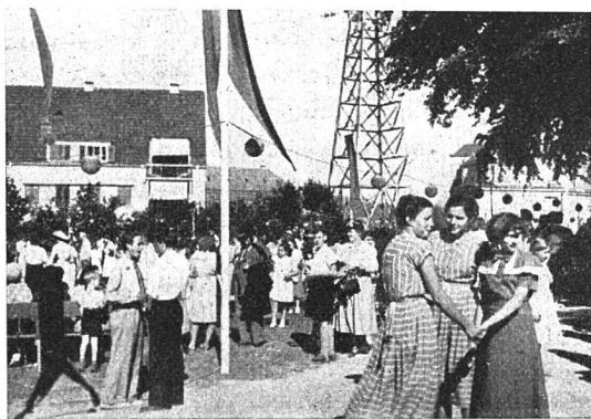
Ein Teil der Frohwiese. Zch.-Wollishofen

Diese Beispiele mögen zeigen, daß dort, wo der Wert und die Bedeutung des Weltgenossenschaftstages erfaßt werden, zur Freude der Genossenschaftsmitglieder, insbesondere aber der Jugend, aber auch zum Nutzen der Genossenschaftssache und zur Verbreitung