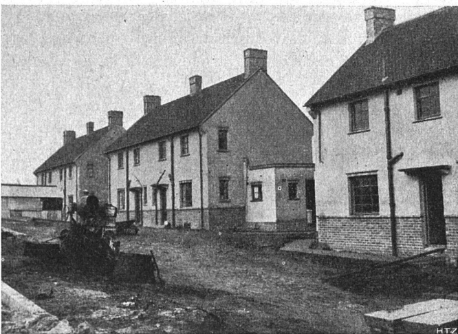
Abb. 5. Unansehnliche Neusiedlung mit außerhalb der Häuser angeordneten Ablaufleitungen