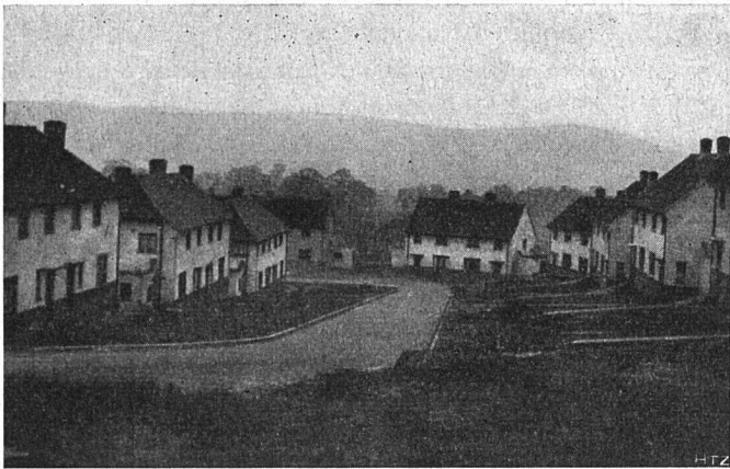
Abb. 3. Moderne Wohnhaussiedlung an Betonstraße