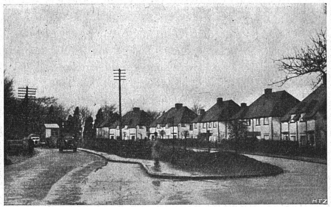
Abb. 4. Neusiedlung an einer Nebenstraße; von der Hauptverkehrsstraße abgerückt