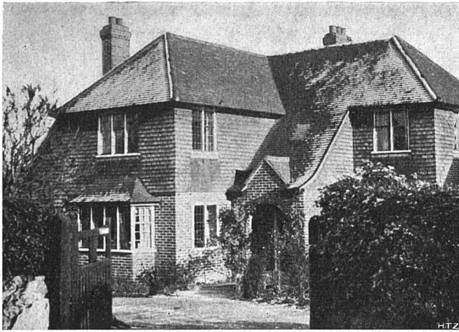
Abb. 1. Neuere Einfamilienhaus