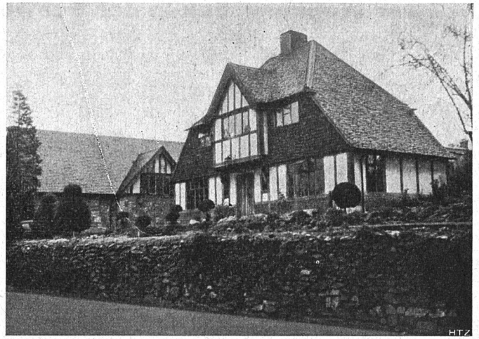
Abb. 2. Älteres Einfamilienhaus