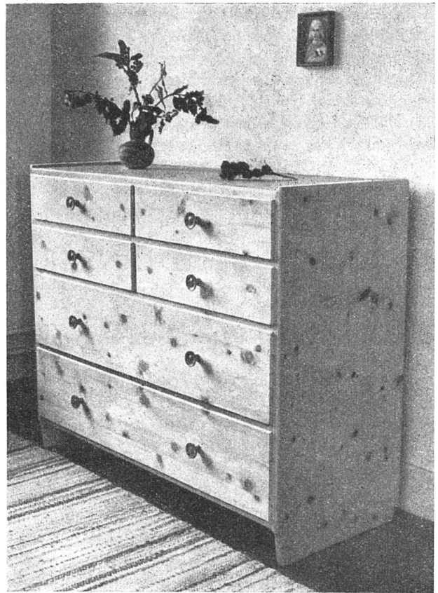
Formschöne Kommode aus Arvenholz, die viel faßt und doch im kleinsten Zimmer oder Vorzimmer Platz hat.

Nun werden sich aber die Leser fragen: «Wer arbeitet denn überhaupt nach diesen Prinzipien? Und kann man sich denn wirklich gediegen einrichten mit kleinem bis mittlerem Einkommen?» – Hier dürfen wir ihnen sagen, daß seit bald zwei Jahren in Zürich eine Schreinerengenossenschaft besteht, die unter anderm eigens dazu gegründet wurde, diese beiden Fragen zu beantworten. Aber es ist nicht umsonst eine Genossenschaft: Außer dem Willen, mitzuhelfen bei der Schaffung von Möbeln, die durch ihre einfache Schönheit und ihren erschwinglichen Preis für alle Menschen zur Verfügung stehen sollen, die sich im Sinne einer besseren Wohnkultur einrichten wollen, achtet sie besonders auf die guten Arbeitsverhältnisse. Sie gewährt zum Beispiel ein weitgehendes Mitsprache- und Mitbestimmungsrecht der Arbeiter, das ein hohes Maß an genossenschaftlicher Gesinnung und Verantwortungsbewußtsein bei Leitung und Belegschaft voraussetzt.