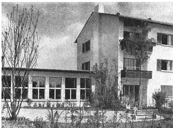
Kindergarten mit Mehrfamilienhaus an der Nordheimstraße

Durch die soeben beschriebene Anordnung der Bauten entstanden fünf beziehungsweise sechs offene Gartenhöfe auf der der Wehtalerstraße abgewendeten Seite der Siedlung, die vollauf deren Bezeichnung als «Sunnige Hof» rechtfertigen. Die Wohnseiten sämtlicher Häuser, und zwar in den Längs- wie in den Quertrakten, sind gegen diese Höfe gerichtet und