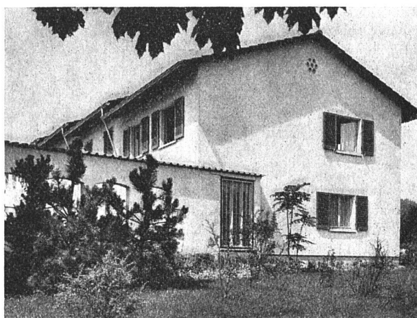
Gestaffelte, senkrecht zur Wehntalerstraße gestellte Einfamilienhäuser

Dem Charakter der eben beschriebenen Baugruppe als des am stärksten in Erscheinung tretenden Teiles der ganzen Siedlung entspricht es, das hier in angemessenem Umfang auch die freie Kunst zur Bereicherung des architektonischen Bildes herangezogen wurde. Kunstmaler E. Häfelfinger erhielt dementsprechend den Auftrag auf ein Wandbild in Sgraffitotechnik, das heute die Hauptfront des Eckbaues gegen die Wehntalerstraße zielt. Er entledigte sich dieser Aufgabe durch