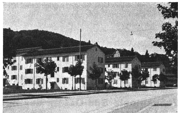
I. Bauetappe Ansicht von der Überlandstraße

cher Bauten soll aber zugleich auch eine glückliche Basis geschaffen werden, von wo aus der Gedanke wahren genossenschaftlichen Handelns und Strebens verwirklicht und beseelt werden kann.