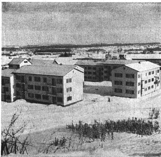
I. Bauetappe Ansicht von der Schwamendingenstraße