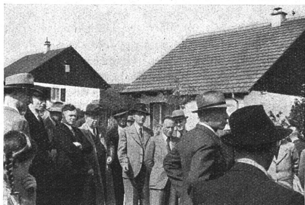
Die Kleinsiedelungen im «Löchlüt» begegnen ausgesprochenem Interesse