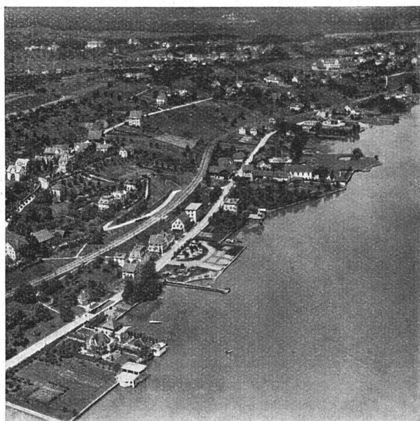
Durch Auffüllung verändertes Ufer bei Wollishofen

bildert und mit Graphiken ausgestattet, ist dem Problem des Landschaftsschutzes am Zürichsee gewidmet. (Im Buchhandel erhältlich. Preis Fr. 5.—) Es deckt schonungslos die zahl-