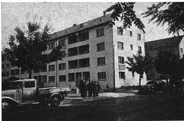
Baugenossenschaft St. Jakob

Die Lösung des Heizproblems entspricht in jeder Beziehung den höchsten Anforderungen. Es wurde