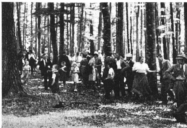
Sammlung zur Landsgemeinde am Genossenschaftstag

Trotz schwerer Zeit haben es sich eine große Zahl von Genossenschaften nicht nehmen lassen, des internationalen Genossenschaftstages zu gedenken. Kinder und Erwachsene haben ihn gefeiert, da mit einer gehaltvollen Abendveranstaltung, dort mit einem gemeinsamen Ausflug, begünstigt vom prächtigsten Sommertag, bald wieder mit einem Spielnachmittag der Kinder und bald mit einer Wanderung der Kleinen. Es ist recht so: wir Genossenschafter dürfen und wollen den Kopf nicht hängen lassen. Arbeiten und nicht verzweifeln, das war von jeher der Leitspruch für unsere Genossenschaften. Er soll es auch bleiben. Denn wir wissen: wenn eine neue Welt geformt werden soll, dann kann das vernünftigerweise und zum Wohle der Menschen nur und allein geschehen in genossenschaftlicher Form, auch da und gerade da, wo man die Genossenschaft bisher zertrümmert hat. Dieser Überzeugung hat auch der Genossenschaftstag 1942 wieder Ausdruck verliehen, und darum haben wir mit Recht gefeiert.