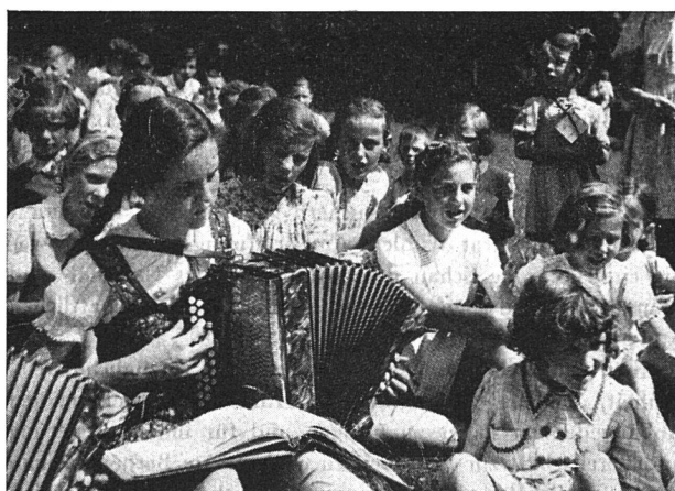
Die Jugend konzertiert