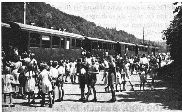
Kinderfreude am Genossenschaftstag