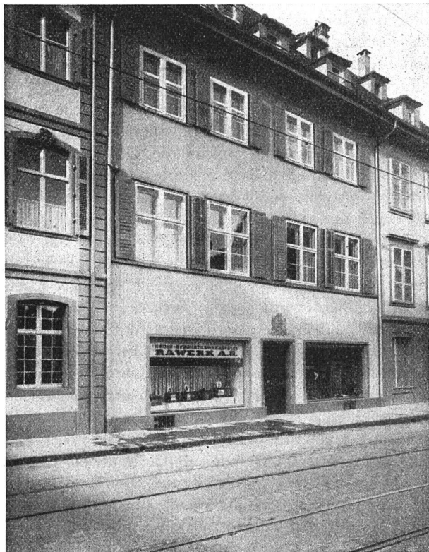
Haus „Zum Mittleren Ulm“ in der St. Johannis-Vorstadt. Es war von Abbruch bedroht und ist nun wieder aufs beste eingerichtet

Haus Nr. 5, «Zum Mittleren Ulm», war ein schönes Patrizierhaus, außen eher bescheiden, innen um so reicher gestaltet. (Siehe Bürgerhaus der Schweiz, Baselstadt, Band 2.) Das Erdgeschoß glänzte durch einen großen, schönen Empfangssaal, war überreich an prächtigen Stukkaturen, seltenen Öfen, Cheminées mit Spiegeln usw. Das Hinterzimmer im Erdgeschoß mit Blick in den herrlichen Garten hat eine hölzerne Barockdecke. Auch der 1. Stock gegen die St. Johannsvorstadt ist mit reichen Decken und schönen Vertäferungen ausgestattet. Der 2. Stock ist sehr einfach und wurde wahrscheinlich im 18. Jahrhundert mit dem Haus Nr. 7 zusammen aufgestockt, wodurch beide Häuser ein gemeinsames Dach erhielten. Bei beiden Häusern wies