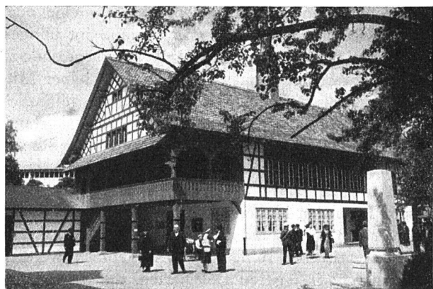
Unser Tagungsort: Das Gemeindehaus im Dörfli