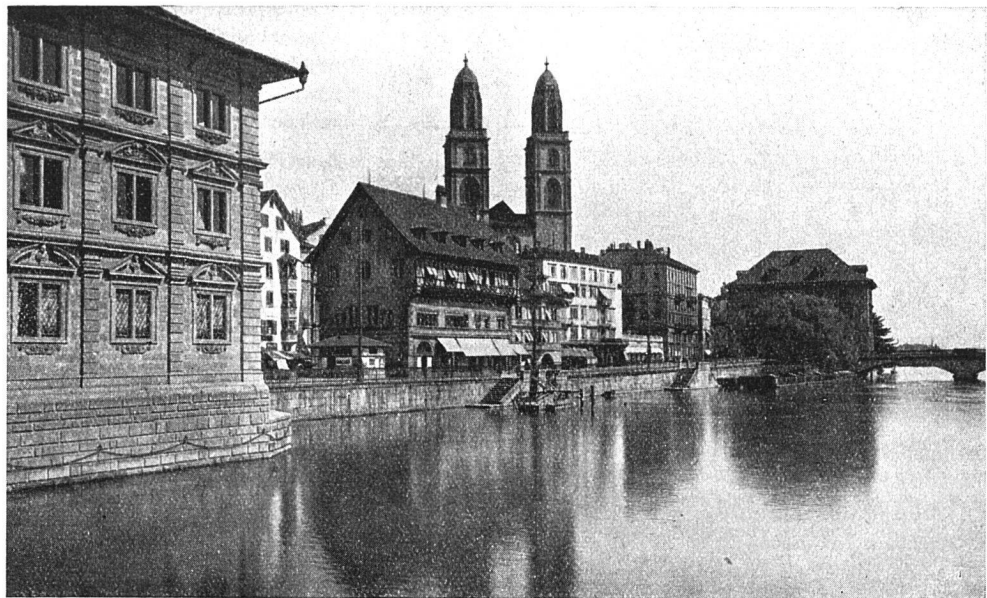
Zürich, Rathaus mit Blick gegen Großmünster und Helmhaus

Der Wohnungsbau hatte also ungefähr mit 2\frac{1}{2} fachen Kosten zu rechnen. Er war damit zu einer sehr wenig lockenden Angelegenheit geworden. Unter der Stagnation aber hatte vor allem der Mieter zu leiden. Die Zeiten mit Mietamt und Mieterschutz einerseits und zahlreichen Schikanen andererseits sind noch allzugut in Erinnerung, als daß wir daran erinnern müßten. An den Bau von Wohnungen aber wagten sich schließlich, gedrängt von der Not der Mieterschaft, die gemeinnützigen Baugenossenschaften heran. Sie übernahmen damit ein großes Risiko, denn es war anzunehmen, daß der Baukostenindex im Laufe der Zeit wieder sinken und damit ein »verlorener Baukostenaufwand« entstehen würde, der die Genossenschaften stark belasten, sie vielleicht gefährden könnte. In der Tat hat eine kürzliche Untersuchung der Bilanz einer größeren Baugenossenschaft gezeigt, daß nur dank einer sehr sparsamen und vorsichtigen Geschäftsführung, dank starker Abschreibungen und Reservestellungen der verlorene Aufwand für diese einzelne Genossenschaft wieder wettgemacht werden konnte. Auch die von Staat und Gemeinden seinerzeit gewährten Subventionen vermochten nicht, den ganzen Verlust,