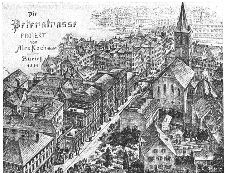
Durchbruch-Projekt Bahnhofstraße-Weinplatz (Rathaus), 1881

Alles in allem: Die Schweiz darf mit Recht stolz sein auf diese Qualitätsleistung, wie sie die Landesausstellung 1939 dank der vorbildlichen Zusammenarbeit und Mithilfe aller Landesteile, aller Berufs- und Bevölkerungsgruppen zustandegebracht hat.