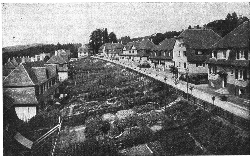
Paul-Brandt-Straße Eisenbahner-Baugenossenschaft Schoren