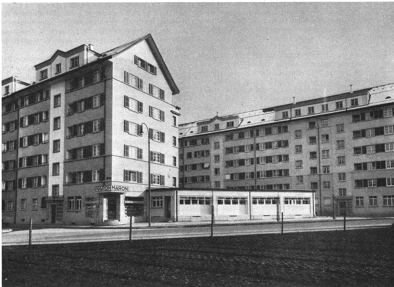
A. B. L., VII. Bauetappe