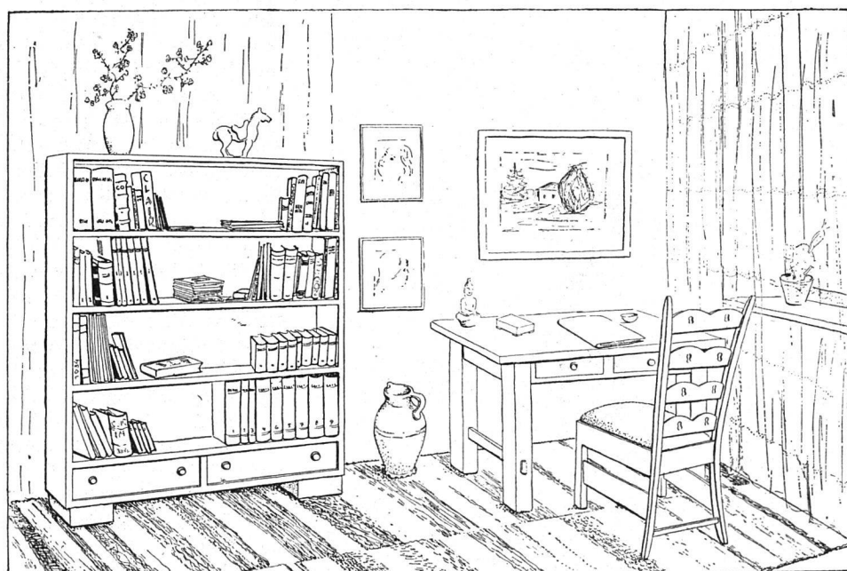
Auch ohne Kostbarkeiten kann ein Heim behaglich sein.

Bevor man an die Bestellung eines Bücherregales geht, vergewissert man sich, wie viele Bücher unterzubringen sind. Ein Vorrat von etwa zwei- bis dreihundert Büchern ist in einem Regal von 150 cm Länge und 170 cm Höhe unterzubringen. Die Bretter wähle man 3 cm stark, das unterste in einem Abstand von etwa 10 cm vom Fussboden zur bequemen Reinigung unter dem Regal. Je nach Geschmack kann man die einzelnen Querbretter, auf denen die Bücher stehen, in gleichem oder unterschiedlichem Abstand zueinander anbringen lassen. Es ist ratsam, wenigstens ein Fach, am besten das unterste, für ganz