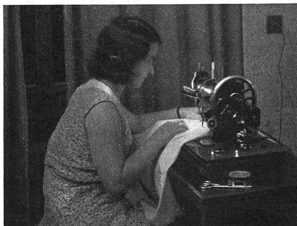
Der kleine Nähmaschinen-Reflektor spendet blendungsfreies Licht. Wenn mehrere Stunden bei künstlichem Licht genäht werden muss, empfiehlt sich die Anschaffung einer Leuchte, die angeschraubt oder an der nächstliegenden Wand montiert werden kann, da das heisswerdende Metall des kleinen Reflektors stören wird.

werden, denn er hängt von der Grösse und Lage der leuchtenden Körperoberfläche im Gesichtsfeld und von der Helligkeit der Umgebung ab. Die Blendungserscheinung ist wohl einer der Hauptfehler, der den Beleuchtungsanlagen im Haushalt anhaftet. Da sie sogar zu dauernden Schädigungen des Augenlichtes führen kann, gilt es, sie unter allen Umständen zu bekämpfen. Ein erster Schritt dazu ist die vollständige Ausschaltung aller Klarglaslampen, an deren Stelle die innenmattierte Glühlampe zu treten