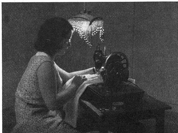
Diese blendende Beleuchtung an der Nähmaschine lässt die Augen schnell ermüden.

Wenn uns die Sonne zu grell auf den Tisch scheint, ziehen wir die Storen. Eine Sonne im kleinen ist die moderne Glühlampe. Von einer relativ geringen