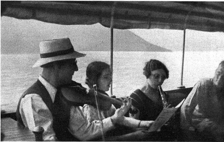
Familienkonzert auf dem Sonntagsausflug

im Menschen überhaupt ursprünglicheres Leben wieder. Und dazu gehört auch sein Singen und Musizieren als der lebendige und wahre Ausdruck persönlichen und menschlichen Lebens und Lebensgefühls. Klar, dass der Mensch seine Musik nun nicht nur in seiner Kammer als eigentliche «Kammermusik» treibt, sondern sie auch in die Natur hinaus trägt. Diesem Bedürfnis kommt entgegen, dass die leisen Instrumente der Hausmusik meist auch leicht tragbar sind. Dabei erfreut sich neben den bekannten Melodieinstrumenten Geige, Querflöte, Klarinette usw. die vor und in der Barockzeit volkstümliche Blockflöte, die in verschiedenen Bauarten und Größen (Sopran, Alt, Tenor, Bass) gebaut wird, besonderer Beliebtheit und starker Verbreitung. Die in den Schulen viel gebrauchten kleinen Schulblockflöten geben eine ganz unzureichende Vorstellung von den vielen und mannigfaltigen (technischen und klanglichen) Möglichkeiten dieses Instrumentes für die