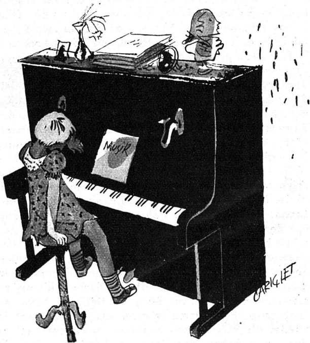
Kleine Kinder, die man zum Klavierspielen direkt zwingen muss, spielen oft mit Begeisterung Blockflöte

im Menschen überhaupt ursprünglicheres Leben wieder. Und dazu gehört auch sein Singen und Musizieren als der lebendige und wahre Ausdruck persönlichen und menschlichen Lebens und Lebensgefühls. Klar, dass der Mensch seine Musik nun nicht nur in seiner Kammer als eigentliche «Kammermusik» treibt, sondern sie auch in die Natur hinaus trägt. Diesem Bedürfnis kommt entgegen, dass die leisen Instrumente der Hausmusik meist auch leicht tragbar sind. Dabei erfreut sich neben den bekannten Melodieinstrumenten Geige, Querflöte, Klarinette usw. die vor und in der Barockzeit volkstümliche Blockflöte, die in verschiedenen Bauarten und Größen (Sopran, Alt, Tenor, Bass) gebaut wird, besonderer Beliebtheit und starker Verbreitung. Die in den Schulen viel gebrauchten kleinen Schulblockflöten geben eine ganz unzureichende Vorstellung von den vielen und mannigfaltigen (technischen und klanglichen) Möglichkeiten dieses Instrumentes für die