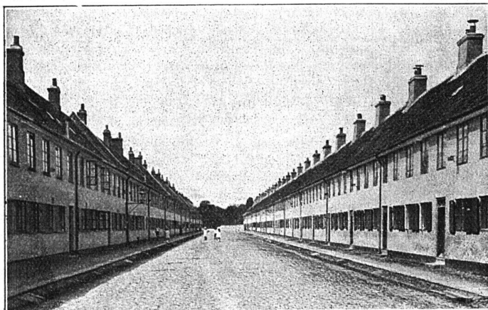
Abb. 1 Kopenhagen. Nyboder, „Neue Buden“, erbaut im 17. Jahrhundert für Seeleute Die Häuser sollen demnächst abgerissen werden, da das Gebiet heute mitten in der Stadt liegt und der Boden sehr wertvoll ist.