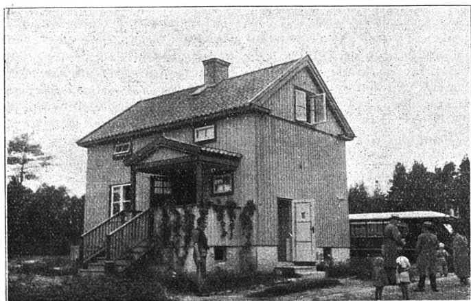
Abb. 5 Stockholm, Gartenstadt Bromma Typisiertes Holzhaus