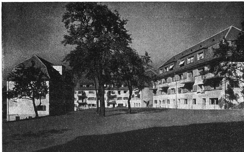
Gemeinn. Baugenossenschaft „Waidberg“ Zürich Kolonie an der Geibel- u. Rosengartenstr.

begrenzten Erfolgen begleitet sind. Es bleibt also nur noch als einzig wirksames Mittel die Tragung eines möglichst grossen Teiles des Bauaufwandes aus öffentlichen Mitteln. Die Bautätigkeit der Gemeinde Wien stellt den grosszügigsten und erfolgreichsten Versuch auf diesem Gebiete dar.