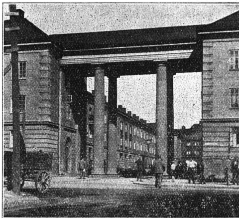
Abb. 2 Oslo, Wohn- kolonie Nor- dre Aasen Pompöser Eingang