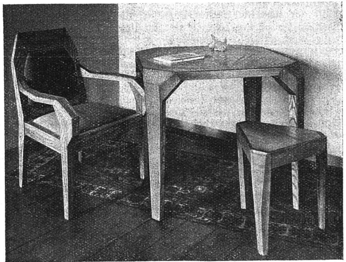
Tisch, Sessel und Hocker in Eschenholz