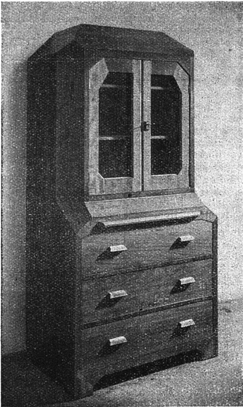
Glasschränkchen mit Schubladen (anstelle eines Buffets) in Birnbbaumholz