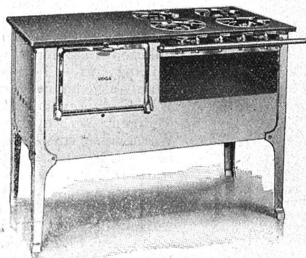
Fig. 2. Gasherde mit halbhochliegendem Bratofen und warmer Abstellplatte über dem letzteren.