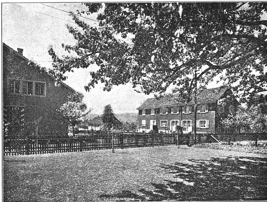
Kolonie der Baugenossenschaft „Allmend“, Zollikon

Fenster erhielten Winterfenster u. Läden, teils Jalousie, teils Rolljalousie.