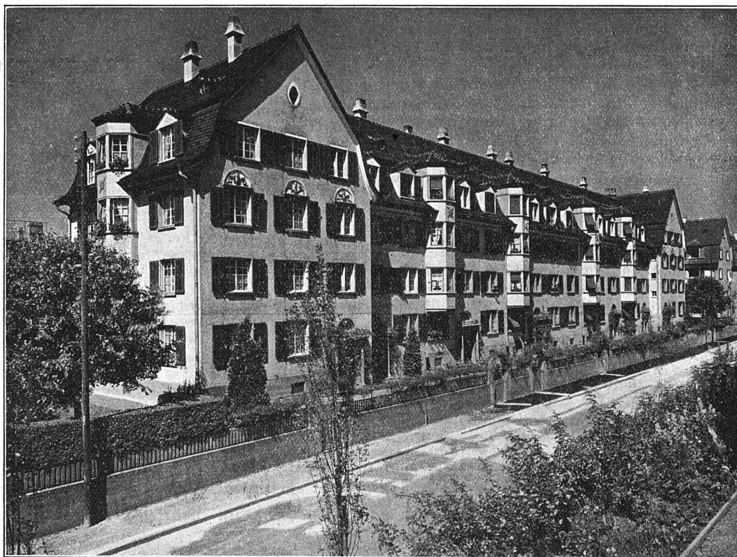
Baugenossenschaft des eidgen. Personals Zürich.

Die Zimmerböden sind Pitchpine II. Qualität. — Küchenböden abgeplättelt. Böden der Badzimmer und Aborte Terrazzo, weisen teilweise Risse auf. Wohn- und Schlafzimmer wie Korridore sind tapeziert. Alle Wohn-