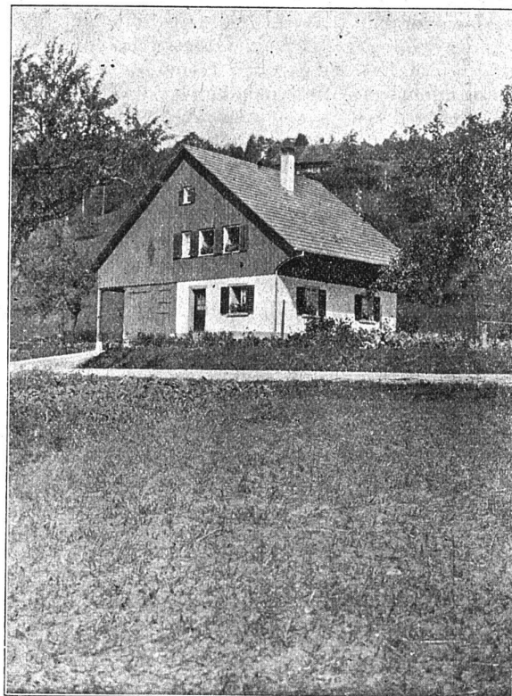
Zum Artikel Kolonie «Weihertal». Ansicht eines einzelnen Heimwesens.

Die Ausführung der Bauten besorgten je zur Hälfte die Firmen A. G. Baugeschäft Wülflingen und Baugeschäft Hch. Leemann, Töss, im Akkord für schlüsselfertige Erstellung. Der Uebernahmepreis pro Haus betrug 22 100.— Fr. Wasserversorgung im Anschluss an das Wülflinger