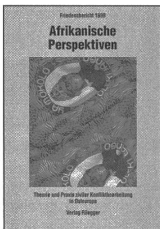
Friedensberichte Hrsg.: ÖFSK Stadtschlaining / SFS Bern in Zusammenarbeit mit AFK Bonn