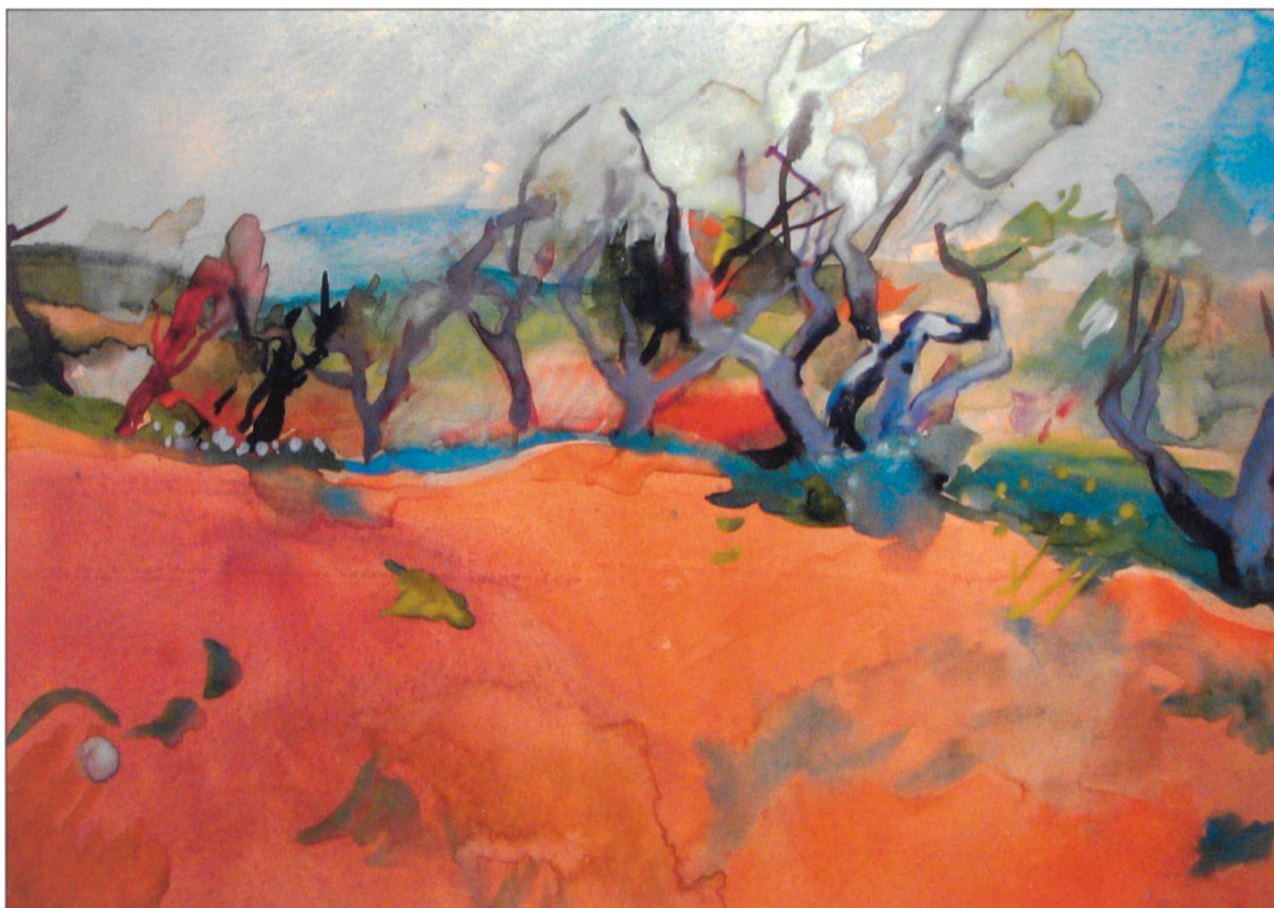
Cogbuf (Ernst Stocker), Südfranzösische Landschaft mit Olivenbäumen, 1936, 34,8 × 47,6 Zentimeter, Sammlung-Robert-Spreng, Reiden: Abbildung 4.

dessen Kunstsammlung ja ausschliesslich über Beziehungen zu Menschen entstand. Kunst zu vermitteln, heisst aber auch – und dies ist eine wichtige Voraussetzung für oben genanntes Ziel –, der Kunst und den Besuchern geeignete Räumlichkeiten zur Verfügung zu stellen. Kunst zu vermitteln, heisst also in unserem Fall, das «bunte Wunder» wortwörtlich ans Licht zu bringen.