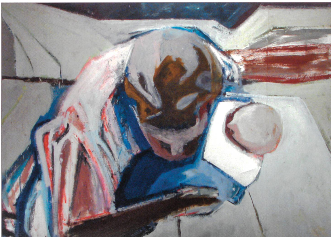
Coghuf (Ernst Stocker), Mutter und Kind, 1930, 120 × 150 Zentimeter, Sammlung Robert Spreng, Reiden: Abbildung 3.