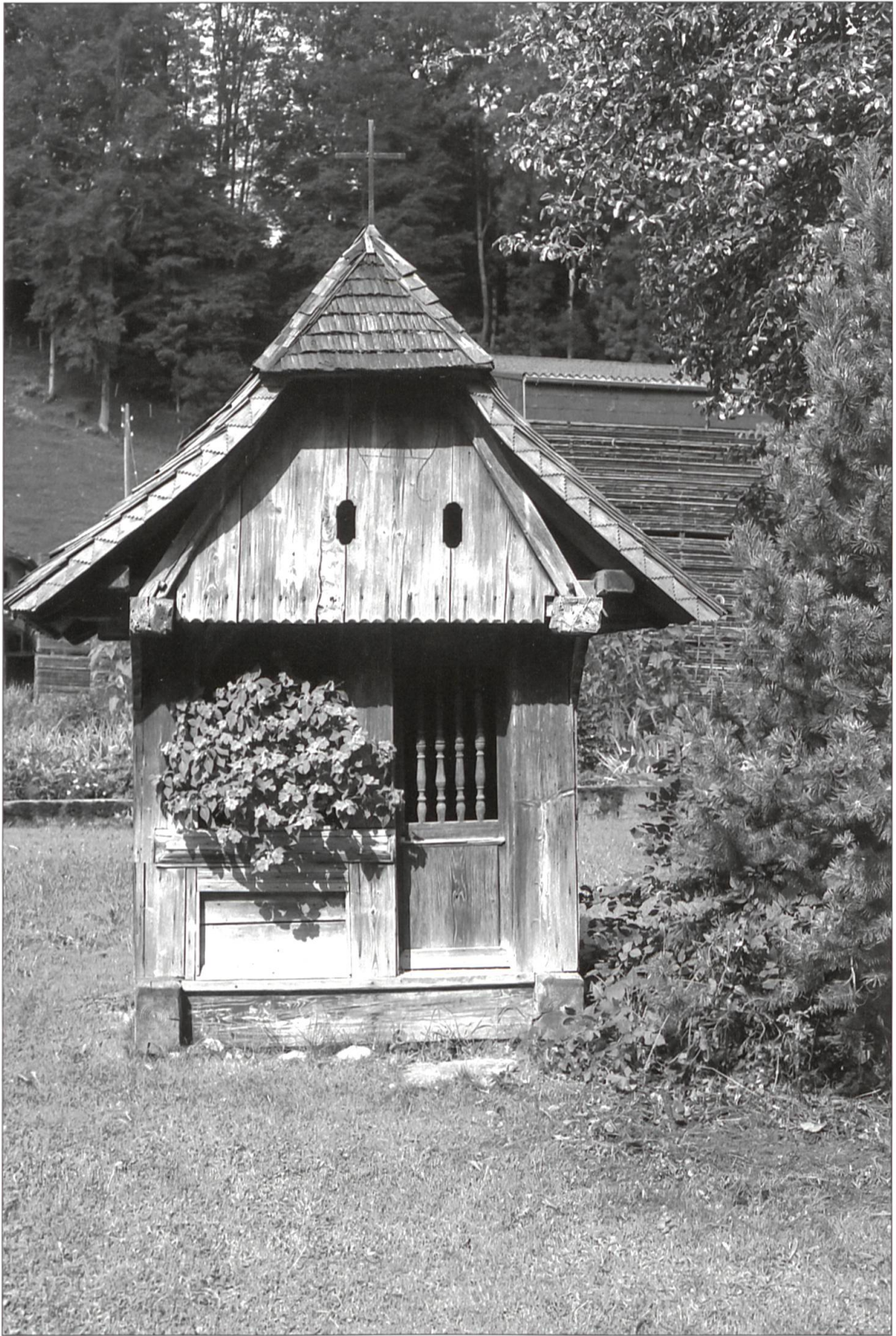
Holzkapelle Hintersagen, Hergiswil, 1986.