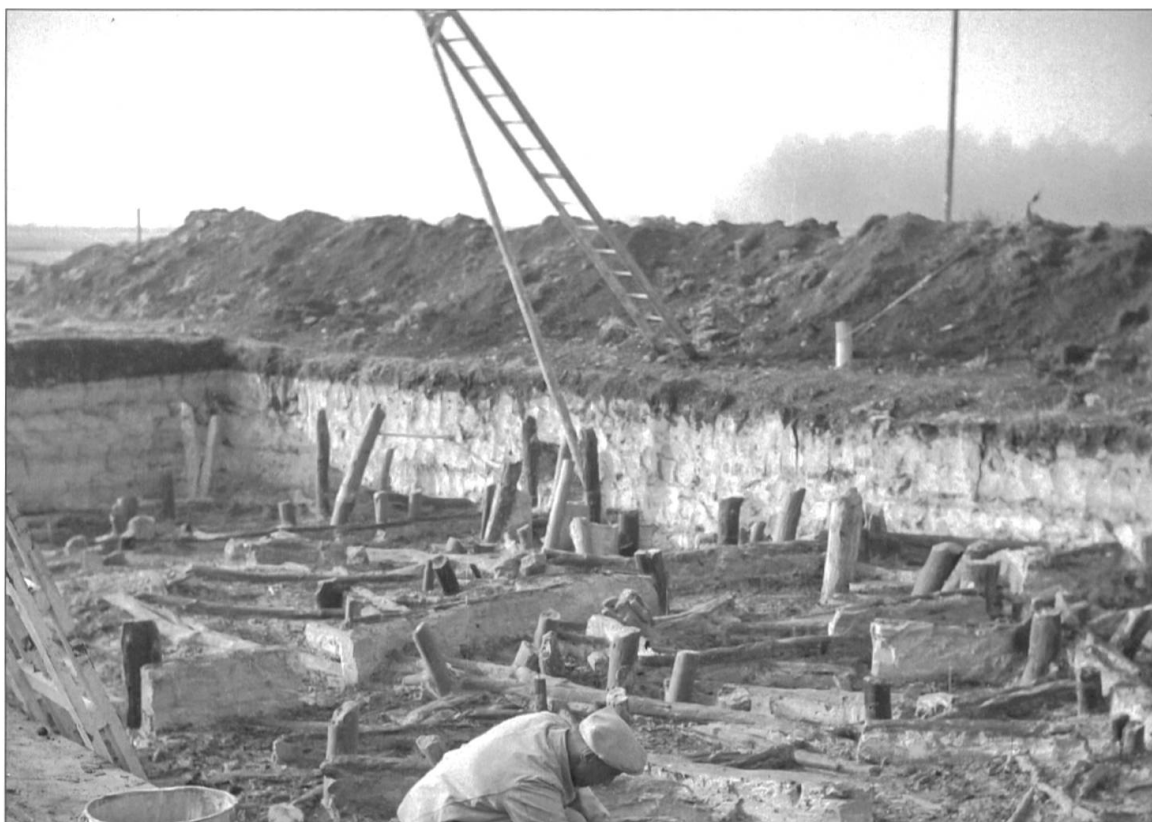
Ausgrabung Pfablbausiedlung Wauwilermoos in den Dreissigerjahren.