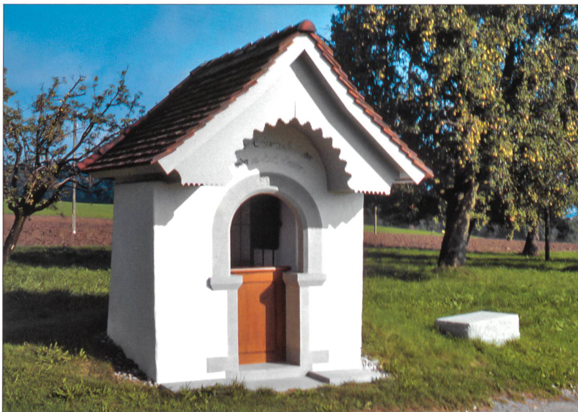
Muttergotteschäppali auf dem Aesch, Warlosen, Ebersecken, nach der Restauration.