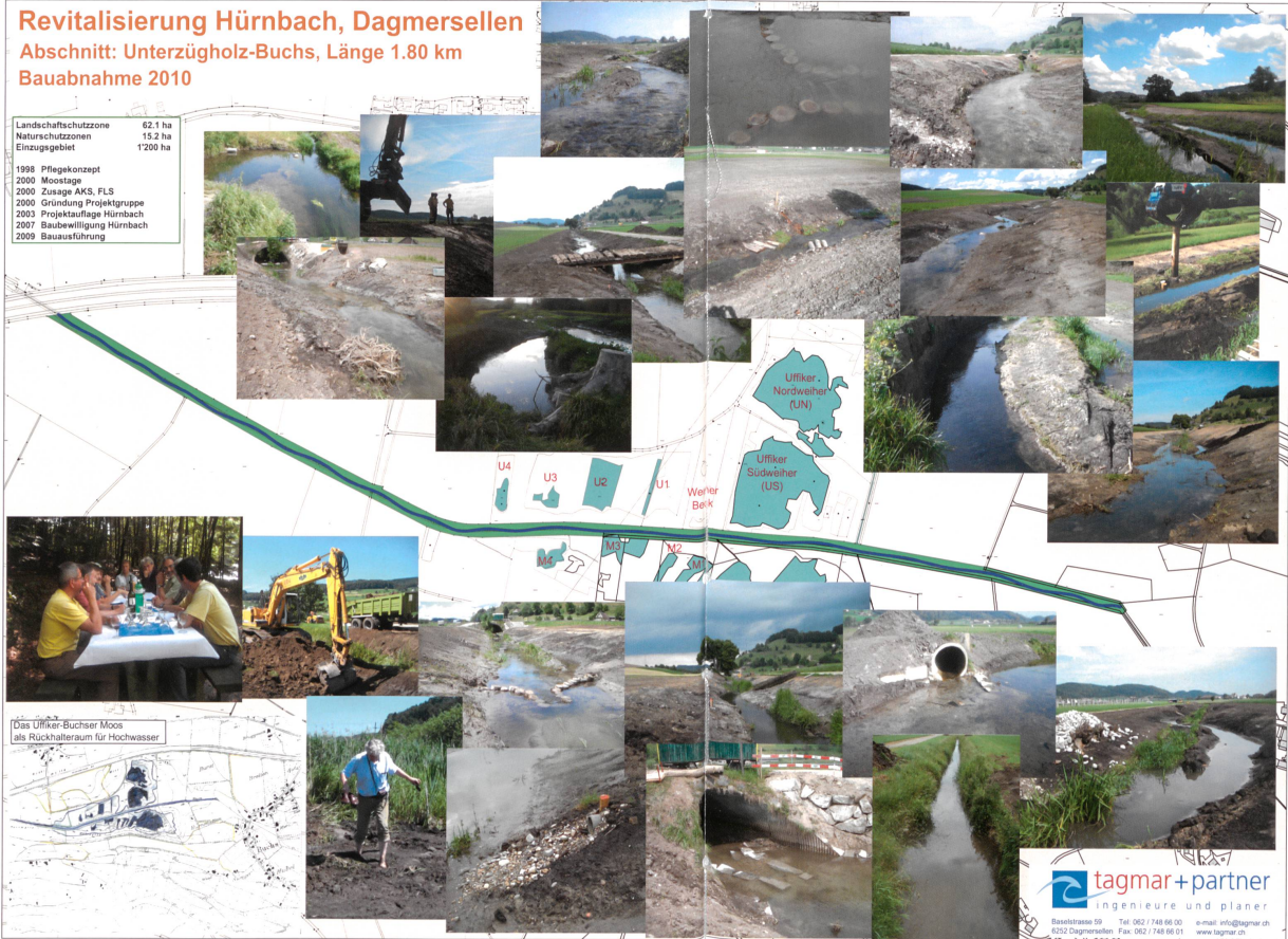
Anlässlich der Baubewilligung wurden mit diesem Tischset die Erinnerungen an die Revitalisierung des Hürnbachs nochmals aufgezeigt. Foto Erich Pfister 1+P

Landschaftsschutzzone 62.1 ha Naturschutzzone 15.2 ha Einzugsgebiet 1'200 ha 1998 Pflegekonzept 2000 Moostage 2000 Zusage AKS, FLS 2000 Gründung Projektgruppe 2003 Projektaufgabe Hürnbach 2007 Baubewilligung Hürnbach 2009 Bauausführung