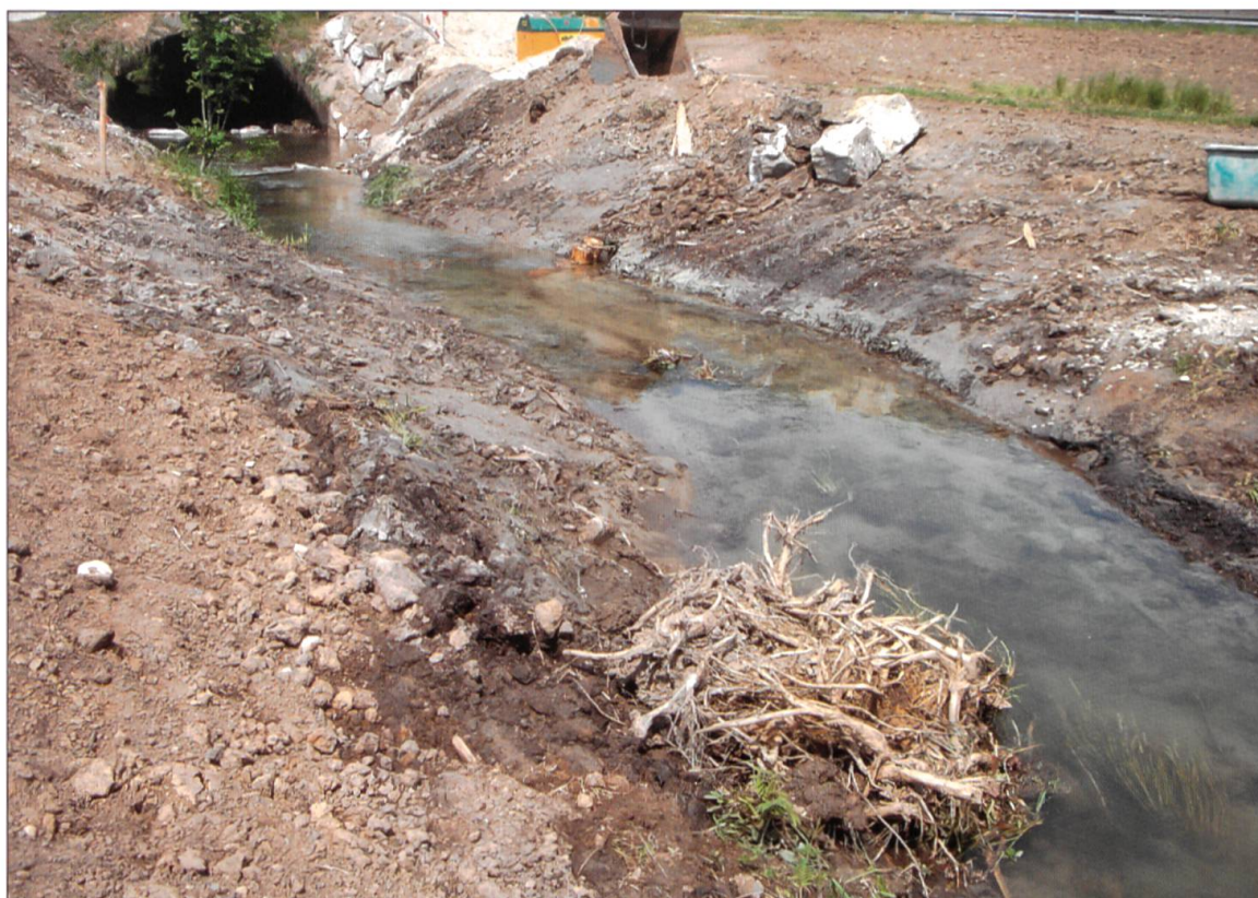
Wurzelstöcke eignen sich gut zur Böschungssicherung und zur Strömunglenkung.