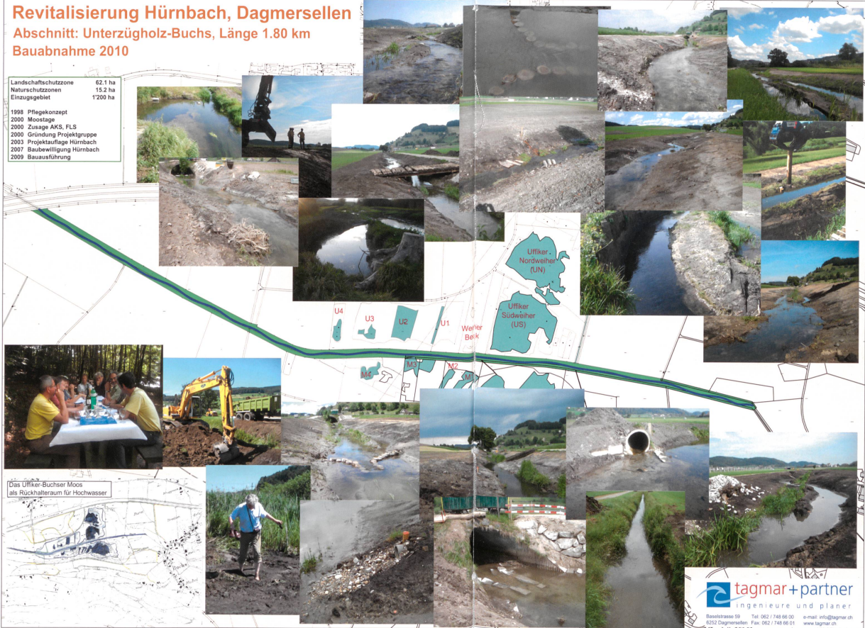
Anlässlich der Baubewilligung wurden mit diesem Tischset die Erinnerungen an die Revitalisierung des Hürnbachs nochmals aufgezeigt. Foto Erich Pfister 1+P

Landschaftsschutzzone 62.1 ha Naturschutzzone 15.2 ha Einzugsgebiet 1'200 ha 1998 Pflegekonzept 2000 Moostage 2000 Zusage AKS, FLS 2000 Gründung Projektgruppe 2003 Projektaufgabe Hürnbach 2007 Baubewilligung Hürnbach 2009 Bauausführung