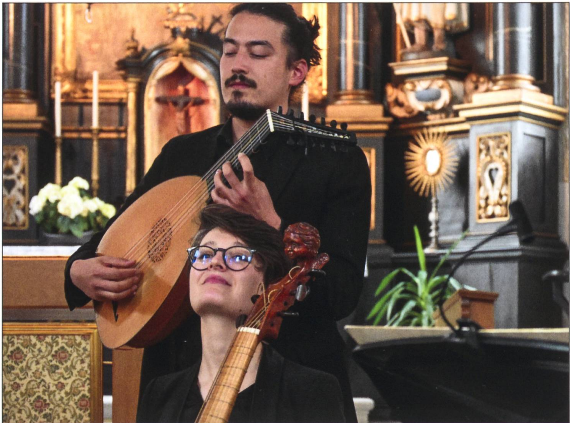
Aufnahme anlässlich eines Konzertes in der Heilig-Blut-Kirche im Mai 2023. Das international zusammengesetzte, fünfköpfige Ensemble Concerto di Margherita pflegt die historische Praxis des Selbstbegleiteten Singens auf höchstem Niveau.