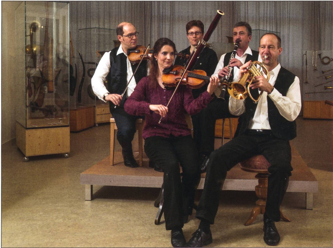
Die Husistein-Musik posiert in der ehemaligen Musikinstrumentensammlung Willisau für eine Fotografie.