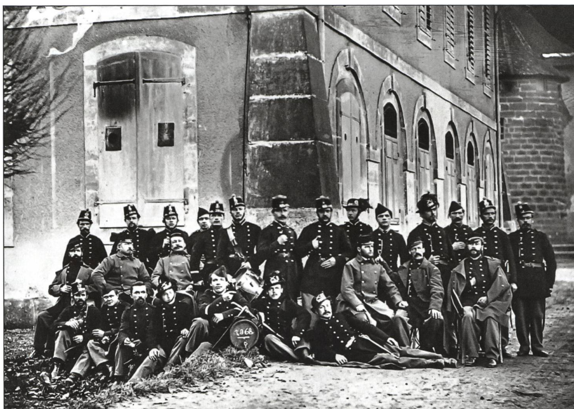
Ein Bild von 1868. Die Schiessbögen sind noch nicht zugemauert.

sche Galerist Richard Haller der Stadt seine Kunstsammlung mit 112 Werken. Die Schenkung stellte er unter die Bedingung, dass die Bilder und Kunstobjekte einen festen Standort erhalten und der Bevölkerung zugänglich gemacht werden. Daraus erwuchs die Idee, ein Kunstmuseum mit Galerie einzurichten. 1981 segnete die Zofinger Bevölkerung einen 2-Millionen-Franken-Kredit für die umfassende Sanierung des heruntergekommenen Gebäudes ab. Am 16. Juni 1983 war es so weit: Das renovierte Kunsthaus wurde eröffnet. Einen Tag später übergab die Stadt das Gebäude zur Nutzung an den Verein «Kunst im Alten Schützenhaus», seit 2014 trägt er den Namen «Kunsthaus Zofingen».