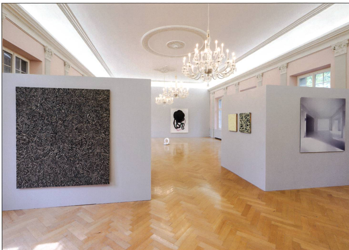
Der Festsaal im Obergeschoss im Rahmen der Ausstellung «Grenzenlos» von 2022.