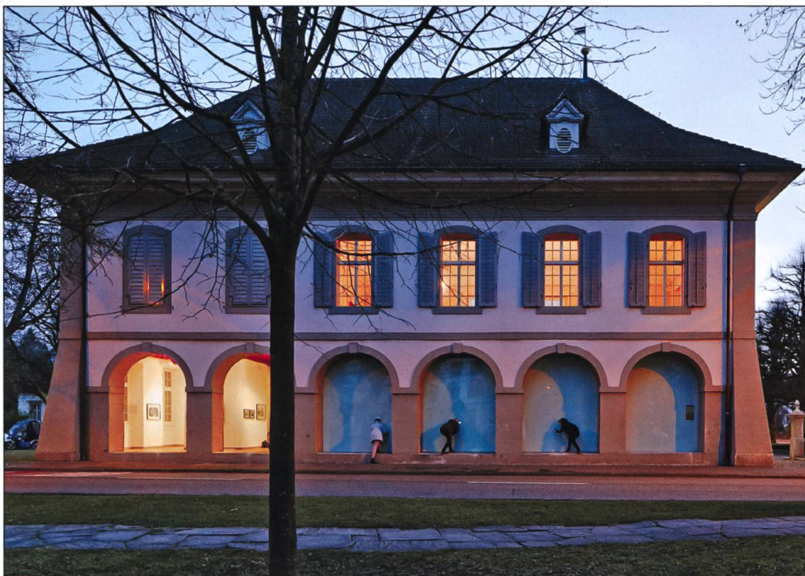
Aussenansicht von Norden. Die sechs Bögen waren einst der Standort der Schützen.