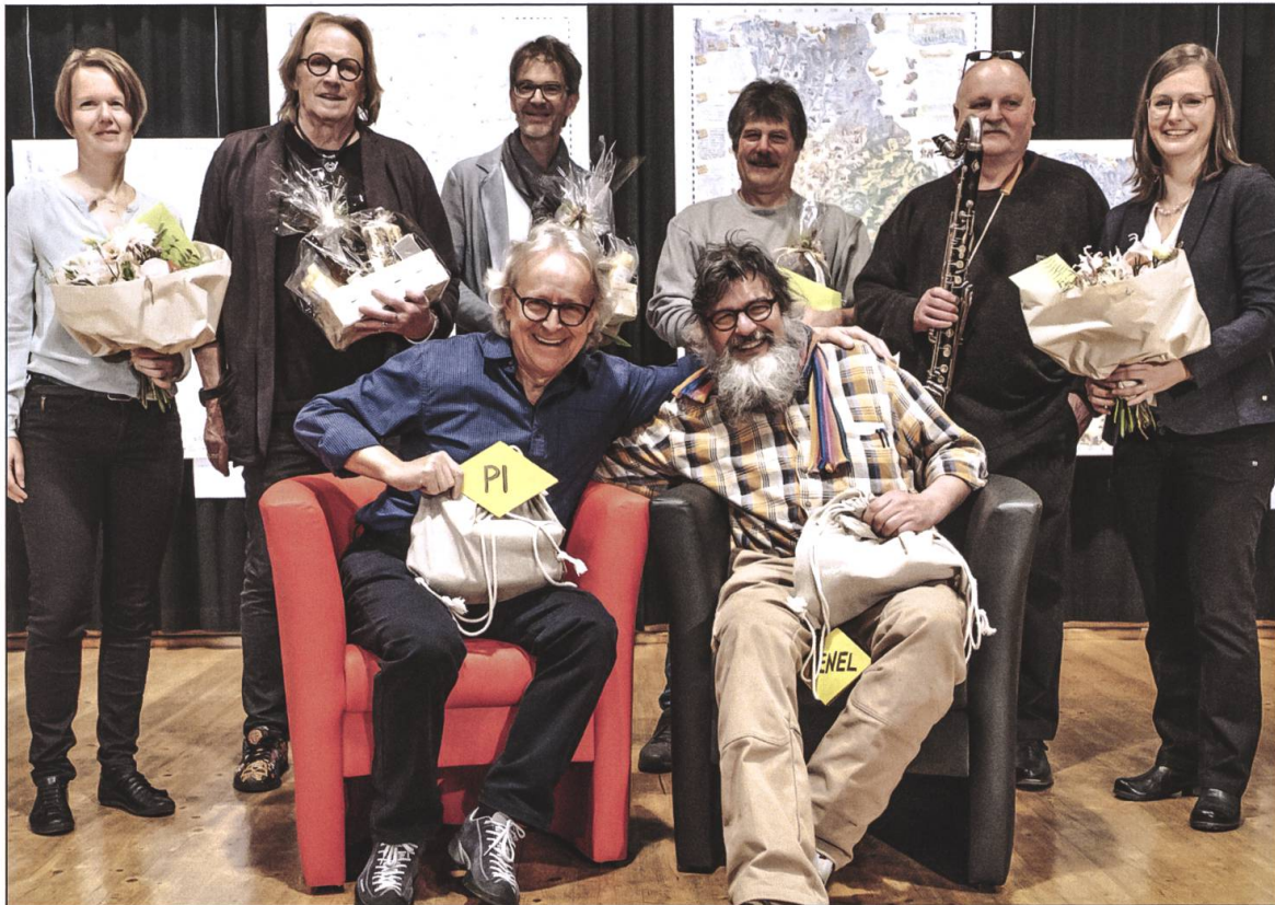
Die Hauptbeteiligten an der Karte und an der Vernissage.