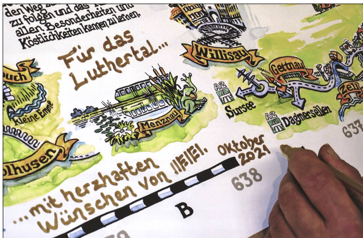
Menel Rachdi signiert die fertige Originalkarte mit Napfgold-Stift.