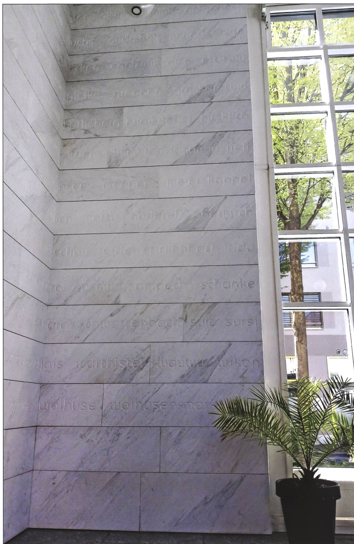
Staatsarchiv Luzern, Kunst am Bau von Aldo Walker, Ortsnamen in Deutsch und Dialekt.