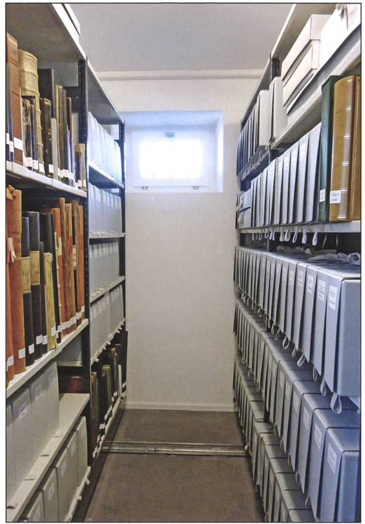
Archivgerecht gestellte Bände und in Schachteln verpackte Unterlagen auf Rollgestellen im Kirchgemeinde- und Pfarrarchiv Altishofen-Nebikon nach der Aufarbeitung 2014.