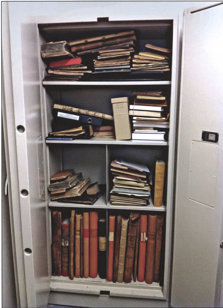
Bände mit Schimmel in einem verschlossenen Tresor im Kirchgemeinde- und Pfarrarchiv Altishofen-Nebikon vor der Aufarbeitung 2013.