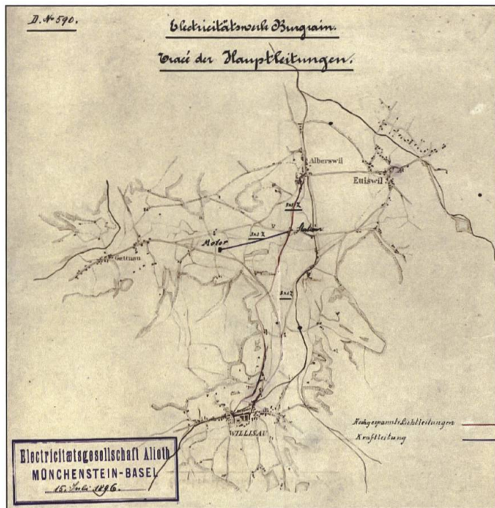
Elektrizitätswerk Burgrain: Plan der Hauptleitungen, 15. Juli 1896.

steht sich. Egger selber erlebte die Vollendung der neuen Ziegelei nicht mehr: 1894 erlag er den Folgen eines Arbeitsunfalls, dieser soll sich auf der Gettnauer Baustelle ereignet haben. 4