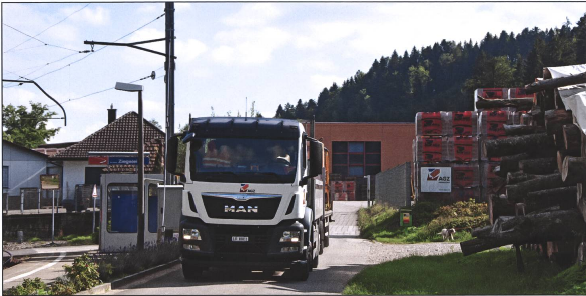
Das heutige Werk in Roggwil BE an der Kantonsgrenze Bern-Luzern.