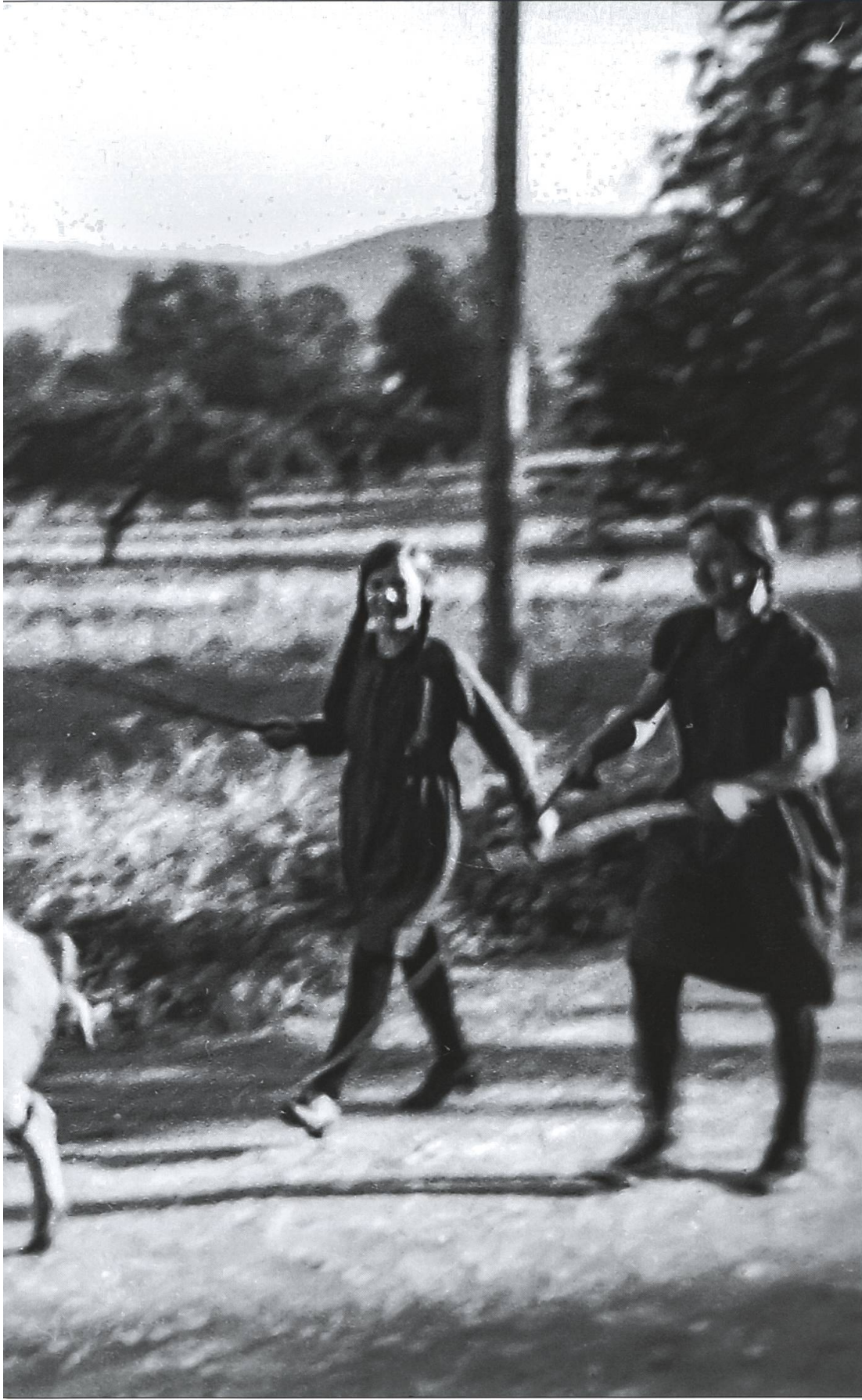
Met de Sou fabre – die Sau zum Eber begleiten, etwa zum Eber eines Nachbarn, und dies gelegentlich mehrmals, bis der Besuch zum Erfolg führt. Personen unbekannt.