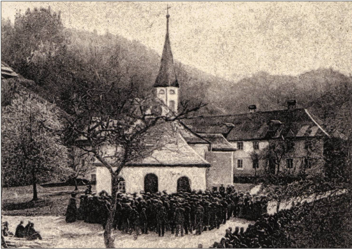
Luthern Bad, Wallfahrtskapelle mit Pilgern, Ausschnitt aus Postkarte Gruss aus Luthern, Poststempel Luthern, 24.06.1904.