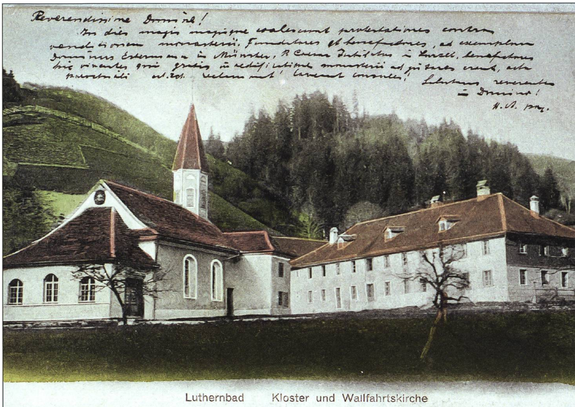
Luthern Bad, Kloster und alte Wallfahrtskirche, handkoloriert, Poststempel 5. Juli 1907.

gen Regeln eines «gottesfürchtigen Lebens» nur schwer unterordnen konnten.