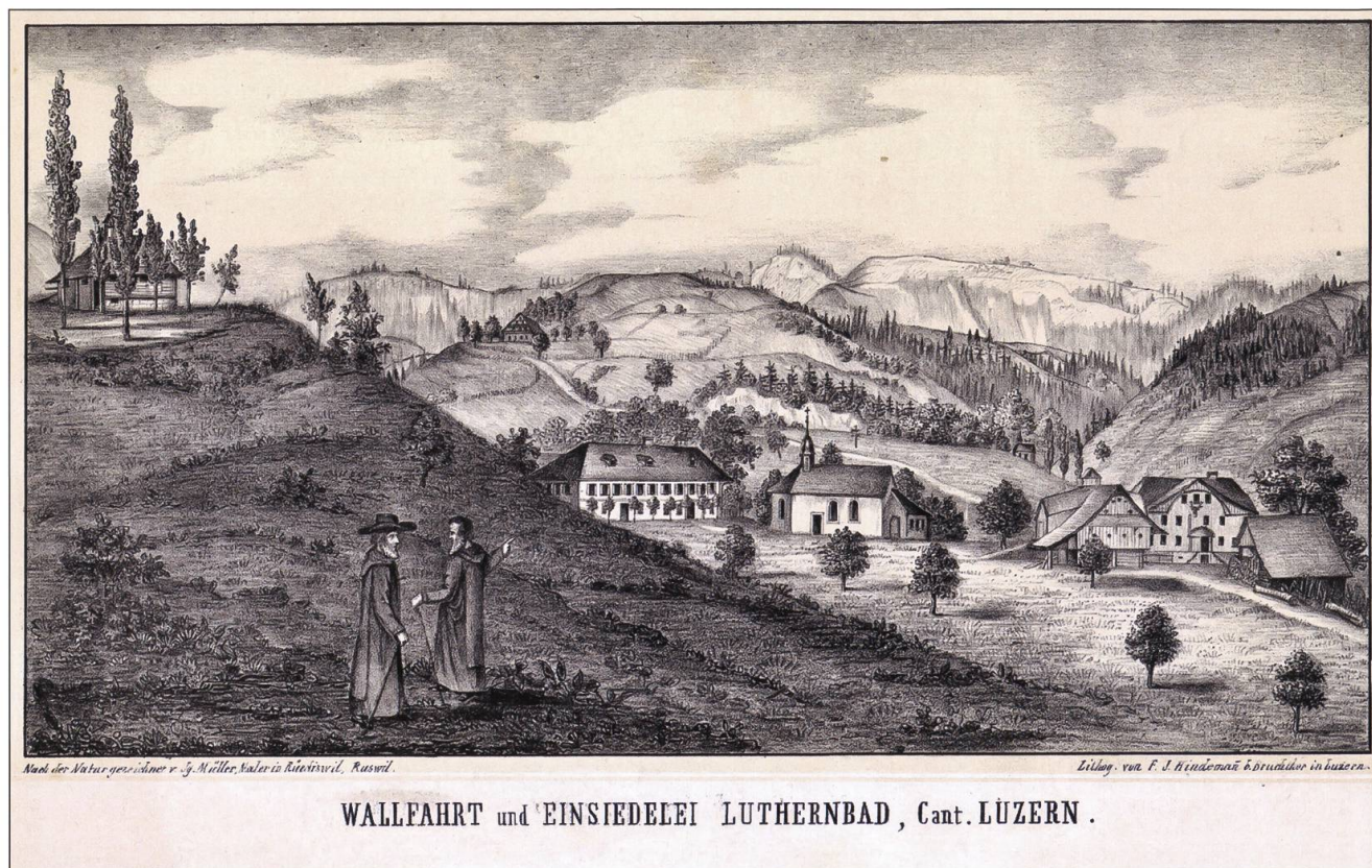
Luthern Bad und Waldbrüder, Lithografie Müller-Hindemann 1846, Original 33,8 mal 18,4 Zentimeter, Napf abgeholzt.

waren sie angehalten, «Disziplin» zu machen, zum Beispiel mit dem langsamen Beten des Psalms «Miserere». Die Absicht bei der Disziplin sei stets «die Abtötung des Leibes, daher Unterdrückung und Schwächung der Begierlichkeiten und die Verehrung des gegeisselten und ganz zerfleischten Gottessohnes.»