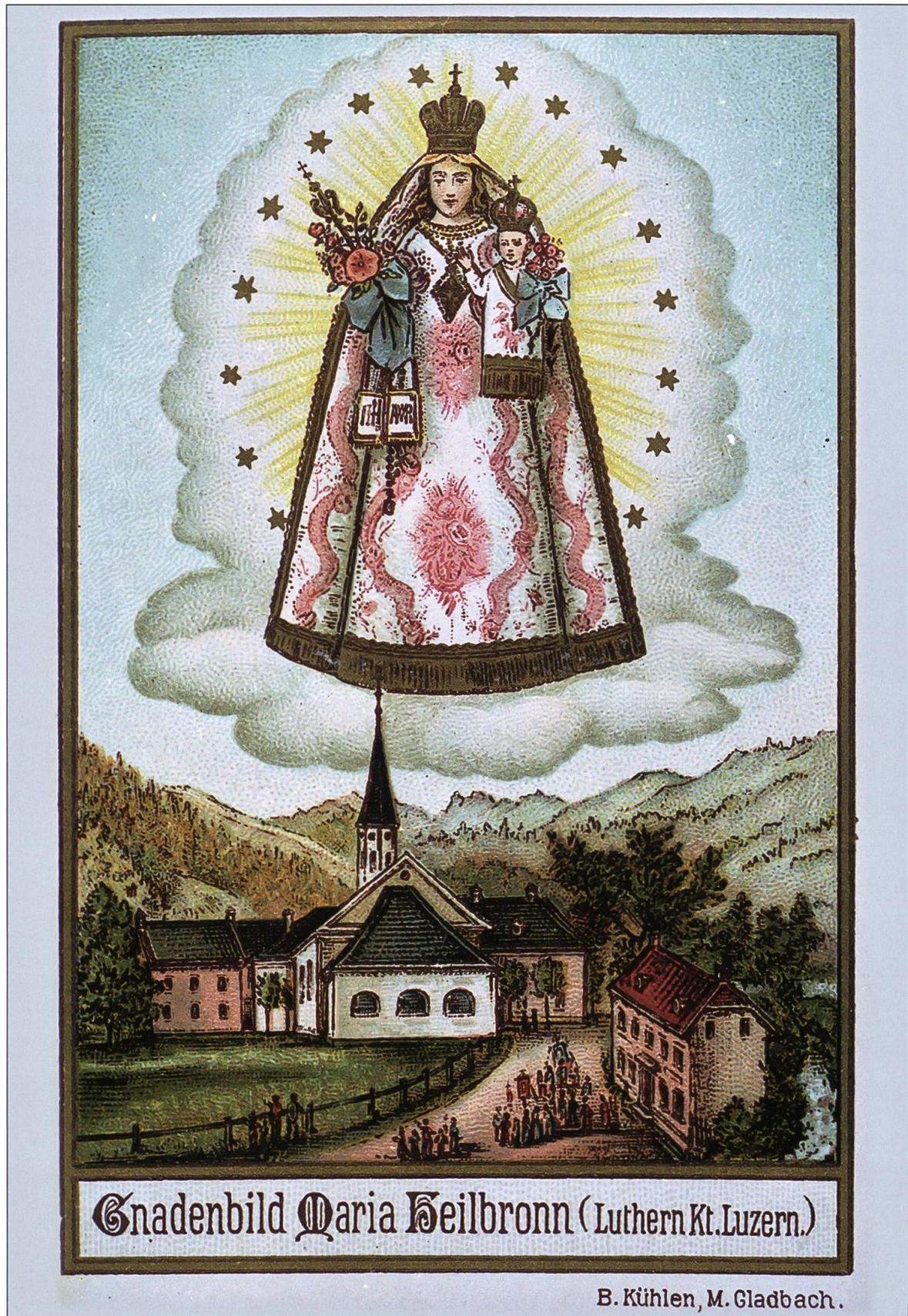
Luthern Bad, Gnadenbild Maria Heilbronn um 1900 von B. Kühlen, Farblitho, Marienerscheinung.