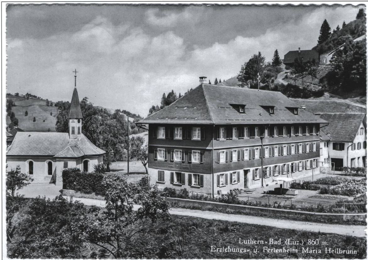
Luthern Bad, Postkarte mit Erziehungs- und Ferienheim Maria Heilbrunn.

Poststempel Luthern Bad, 07.06.1950.