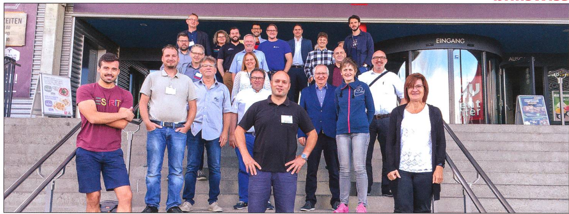
Mitglieder der Gruppe «Lärche» Oftringen nach einem Treffen.

BNI ist ein weltweites Unternehmernetzwerk mit regionaler Ausrichtung. In der Region Wiggertal ist die Unternehmergruppe «Lärche» seit 2007 aktiv, derzeit mit 34 UnternehmerInnen. BNI Schweiz zählt rund 2500 Mitglieder. Die UnternehmerInnen treffen sich regelmässig, um Geschäftsempfehlungen auszutauschen und fördern damit die regionale Wirtschaft. Sitz des Familienunternehmens, die PDR Network AG, ist seit 2005 in Luzern. Mehr Informationen www.bni.swiss