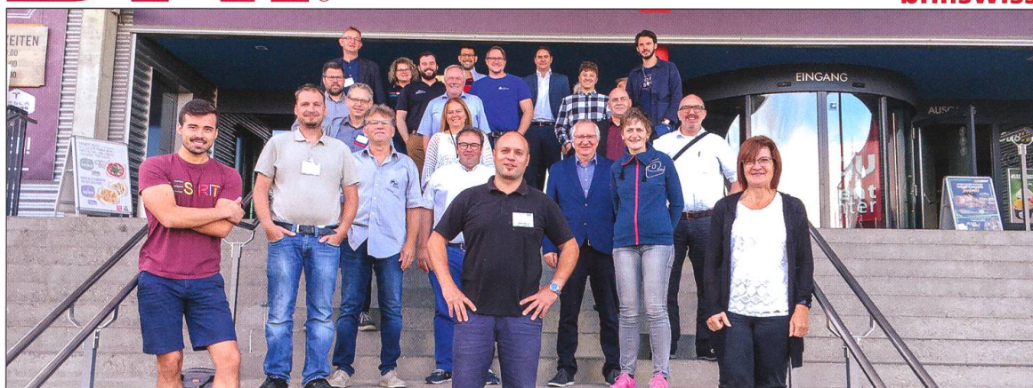
Mitglieder der Gruppe «Lärche» Oftringen nach einem Treffen.

BNI ist ein weltweites Unternehmernetzwerk mit regionaler Ausrichtung. In der Region Wiggertal ist die Unternehmergruppe «Lärche» seit 2007 aktiv, derzeit mit 34 UnternehmerInnen. BNI Schweiz zählt rund 2500 Mitglieder. Die UnternehmerInnen treffen sich regelmässig, um Geschäftsempfehlungen auszutauschen und fördern damit die regionale Wirtschaft. Sitz des Familienunternehmens, die PDR Network AG, ist seit 2005 in Luzern. Mehr Informationen www.bni.swiss