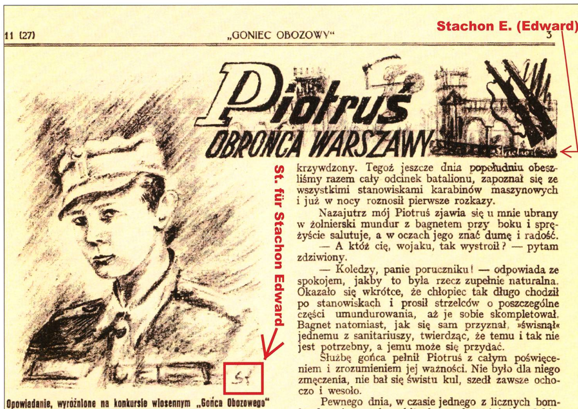
Illustration von Edward Stachon aus der, in der Schweiz erschienenen, Soldatenzeitung „Goniec Obozowy” vom 10. Januar 1941.

namentlich auch die Lagerleitung im Internierten-Straflager Wauwilermoos lange ungeahndet gewähren.