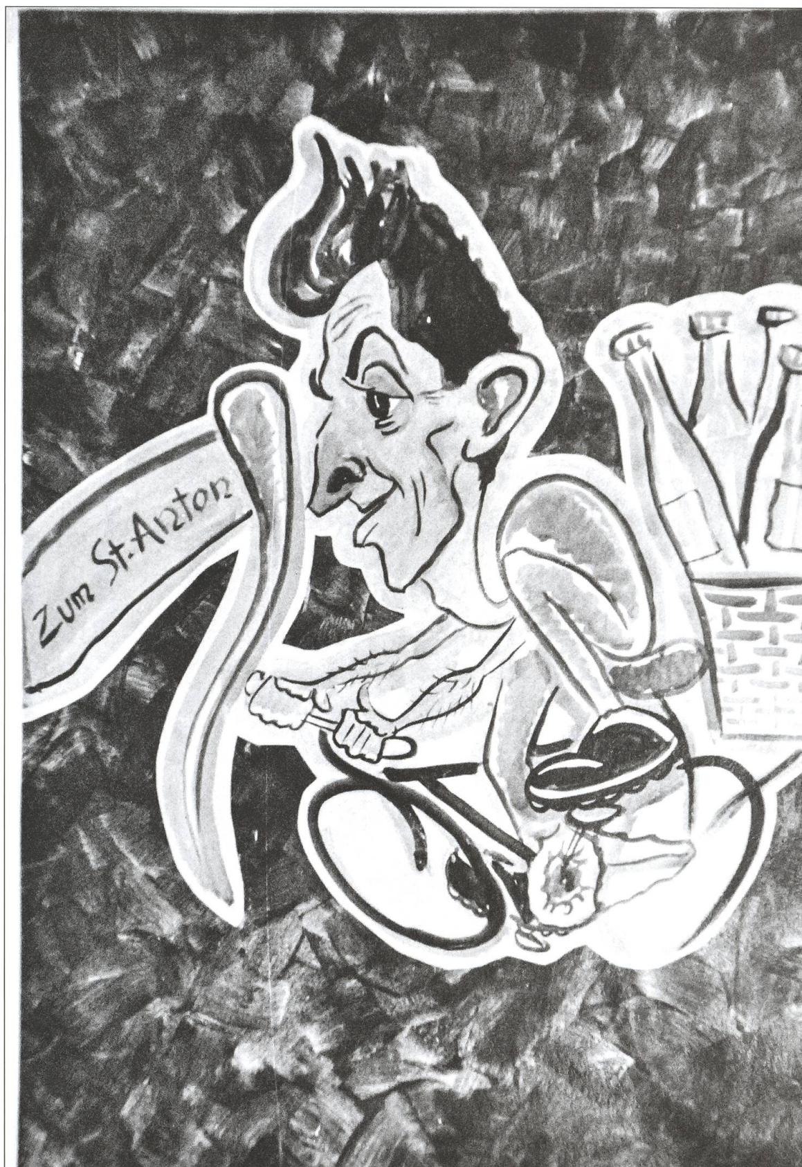
Stanislaw Groszek war vom 10. Oktober 1944 bis zum 30. Januar 1945 im Internierten-Straflager Wauwilermoos, wo er diese Karikatur malte.