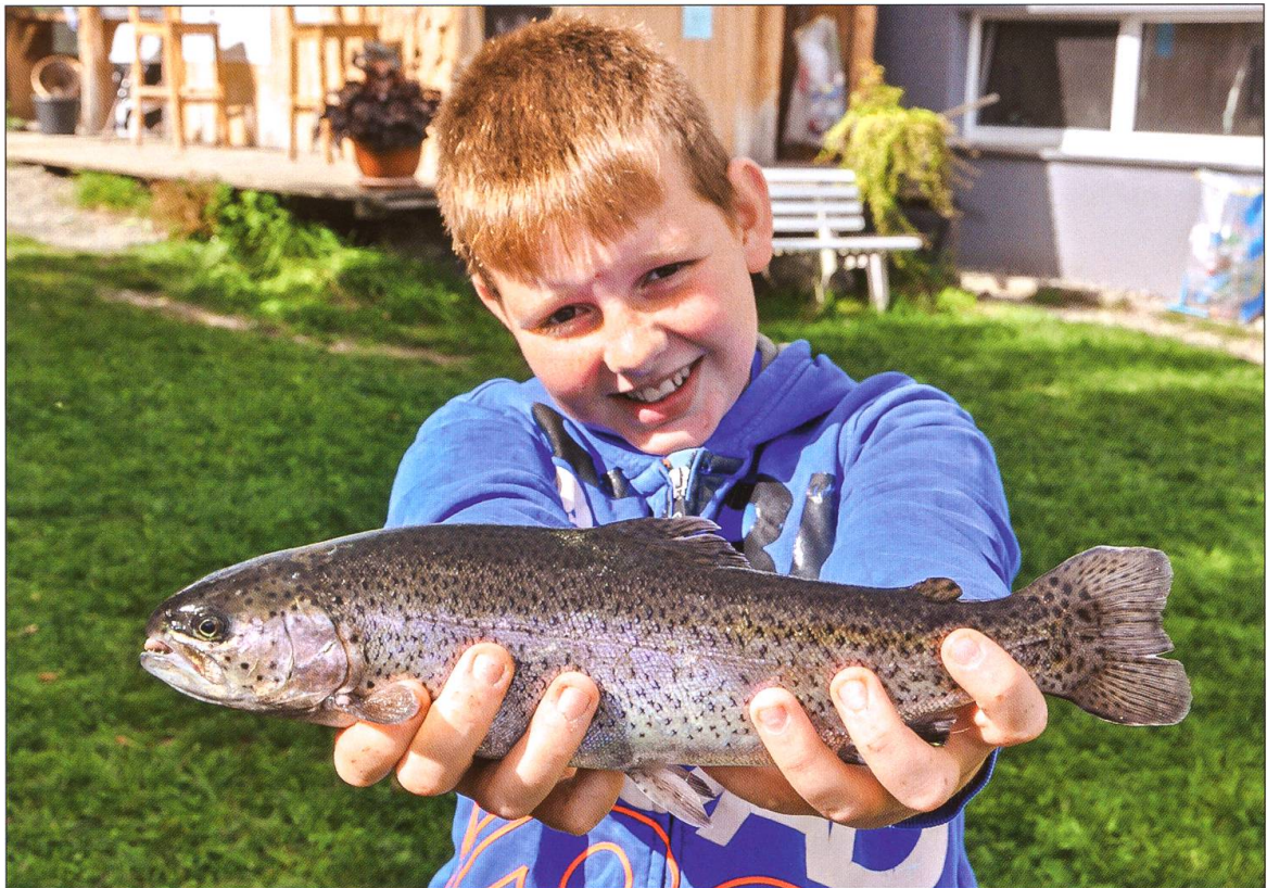
Stolz präsentiert der junge Fischer sein Beute, eine ausgewachsene Forelle.