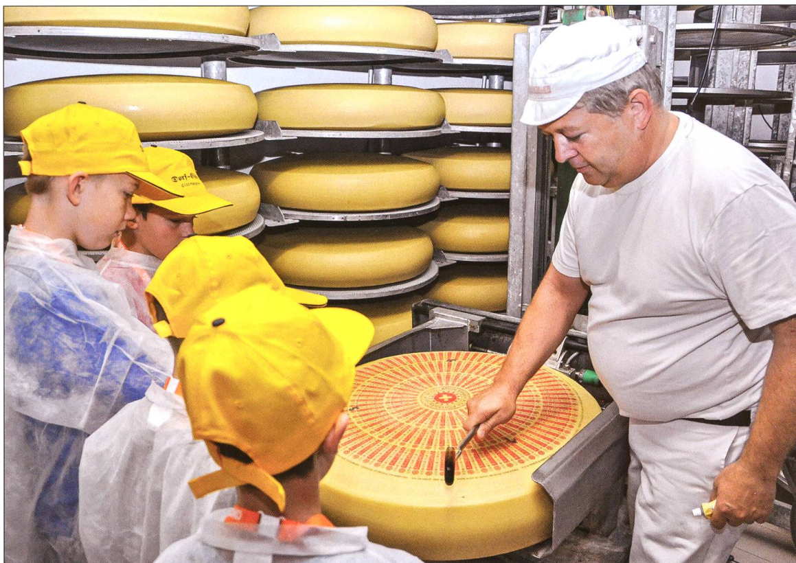
Ob sich der Käse wohl erwartungsgemäss entwickelt? Die Kontrolle wird es gleich weisen.