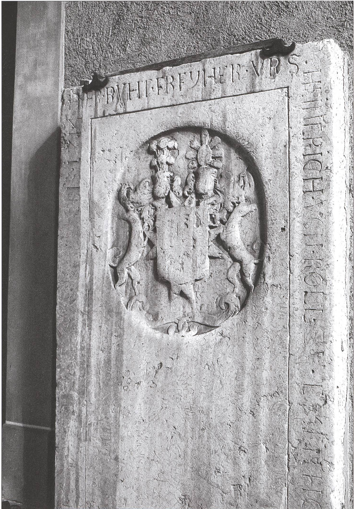
Grabplatte Urs Heinrich von Rolls, des Komturs von 1672 bis 1680, der die Kommende entscheidend umgebaut hat.