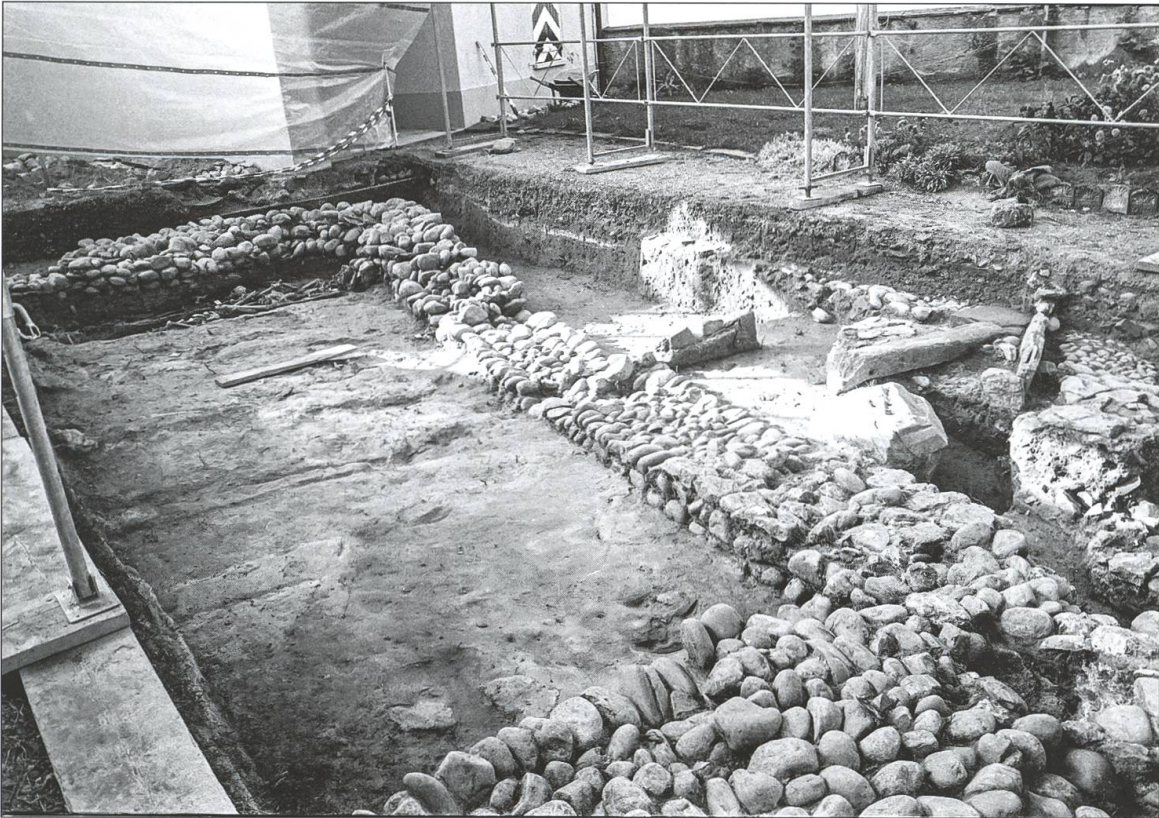
Nach erfolglosen früheren Grabungen im Kommendehof wurde im September 1987 das Fundament der 1813 abgebrochenen oberen Kirche freigelegt, deren Türmchen auf dem Herrliberger Stich weit über das Dach des Hauptgebäudes hinausragt.

scher Glaube, was ein Pfarrer bezeugen müsse. In der Regel leisten die Mitglieder des Hospitaldienstes ihren Einsatz in bestehenden sozialen Einrichtungen, zum Beispiel in Alters- und Behindertenheimen oder beim Mahlzeitendienst «Tischlein deck dich».