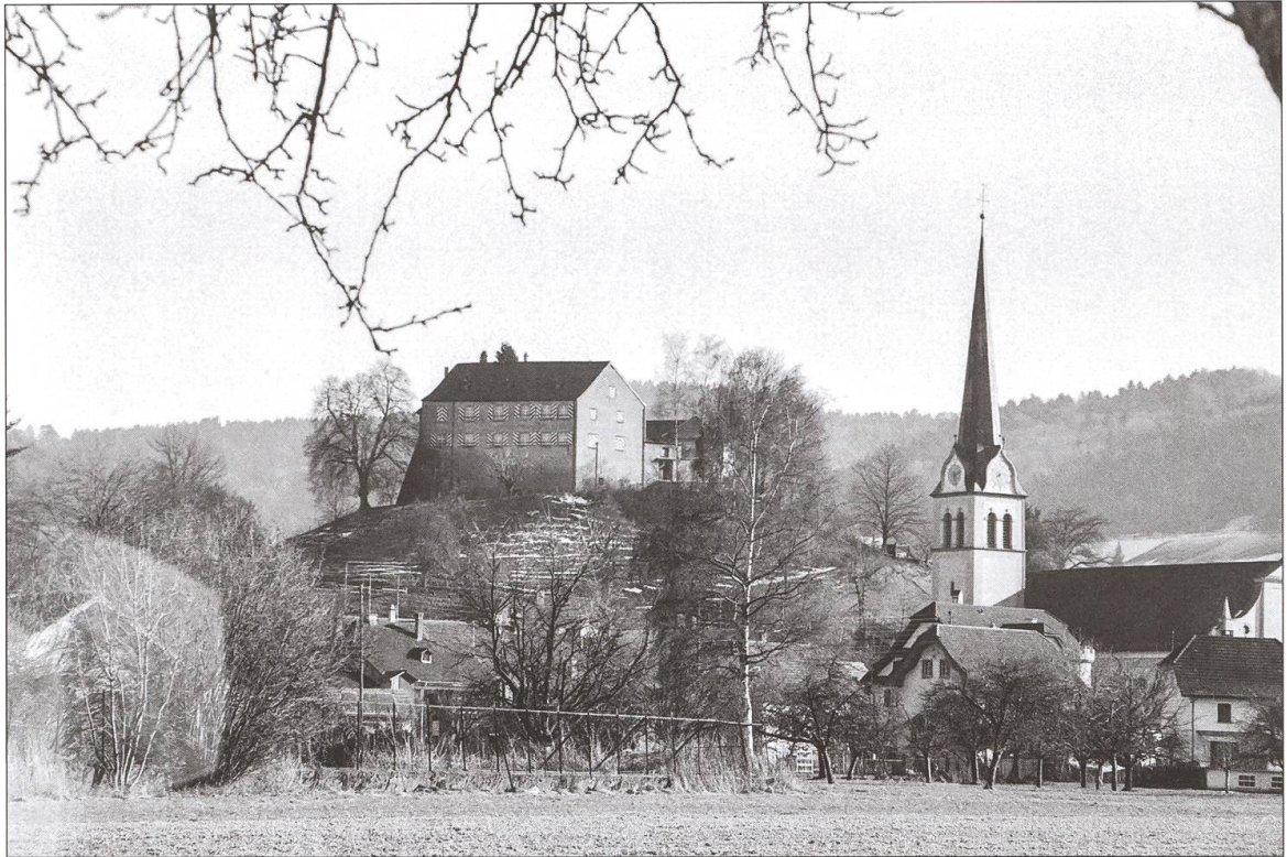
Blick von Nordwesten auf die Reider Pfarrkirche und die Johanniterkommende vor der Restaurierung.