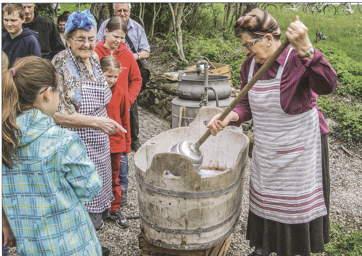
Saisoneröffnung im Mai 2013: Haushalten wie zu Urgrossmutter's Zeiten (Kochen, Nähen, Bügeln und Waschen).

dig stabilisiert werden. Anschliessend erfolgten während eines Jahrzehntes verteilt Investitionen in die Attraktivität des Gebäudes, den Veranstaltungskalender, den Aussenraum mit Unterstand für festliche Anlässe und Museums-Events, Toiletten und so weiter.