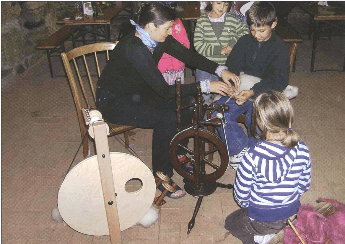
Saisonschlussveranstaltung im September 2007 mit dem Thema: «Rund um die Wolle» oder «Vom Schaf zum Kleidungsstück»: Waschen, Karden, Spinnen, Filzen, Weben ...

der unmittelbaren Betroffenheit über den plötzlichen Hinschied des Museumsgründers hinaus? Würden sich Menschen finden, die bereit waren, in einem noch zu gründenden Verein über längere Zeit als Vorstandsmitglieder Freizeit einzusetzen und Verantwortung zu übernehmen?