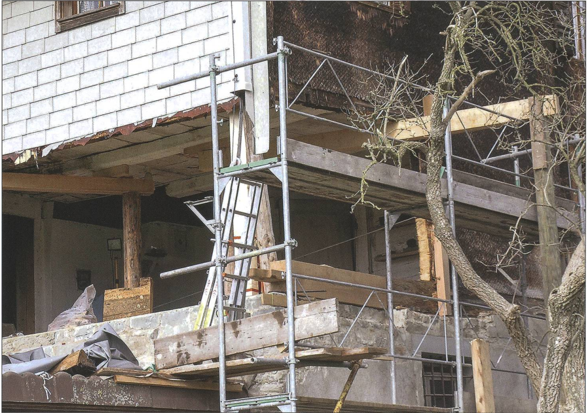
Grosse Restaurationsarbeiten im Frühling 2005. Kellermauern, Kellerdecke, Küchenwände und Küchenboden mussten dauerhaft statisch gesichert und mit viel Titan und Stahl, Beton und Mörtel, Holz und Steinen saniert werden.

wortet werden können; von mir und Menschen, die Paul Würsch zum Teil während Jahrzehnten nahegestanden hatten und bereits wenige Monate nach dem Tod eine Initiativgruppe bildeten.