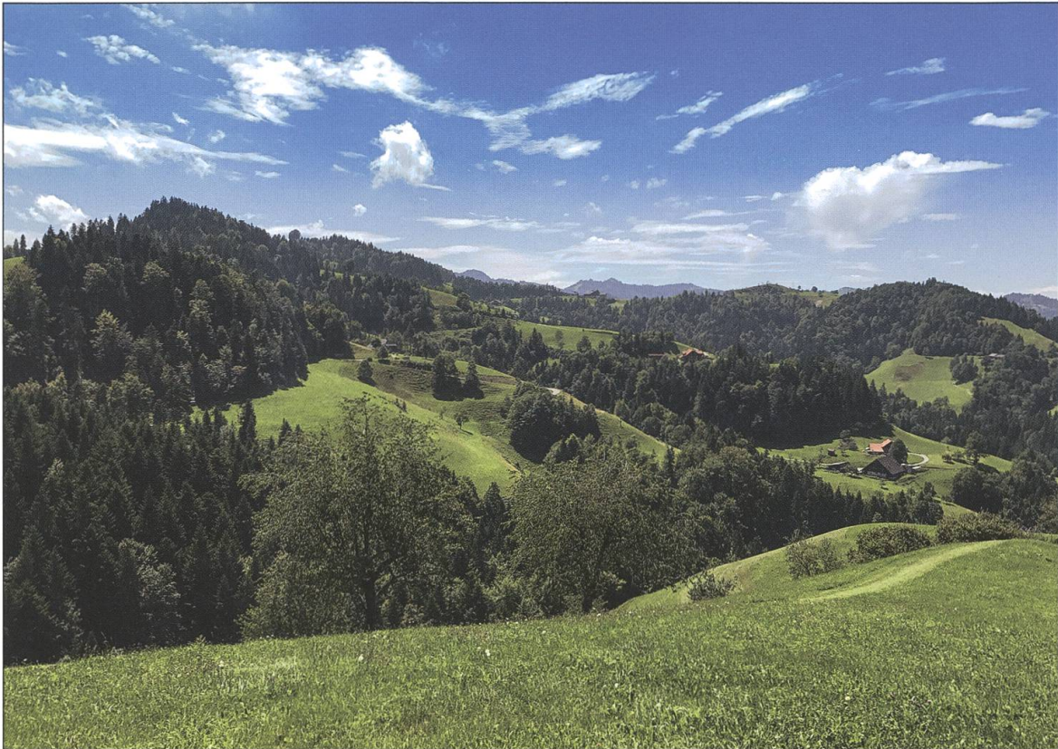
Blick vom Petsch (Menzberg) auf das Land der Eggen und Gräben.

dern ganz stark auch von Menschenhand so geschaffen worden ist, wie wir sie kennen. Als vor rund 1000 Jahren die ersten Menschen in unsere ausweglosen Täler gelangt sind und sich hier niedergelassen haben, war diese Landschaft mit Urwald bestanden. Wer sich hier niederlassen wollte, musste zuerst Wald roden. Davon zeugen noch immer die vielen Rüti- und Schwandnamen. So haben sich die Bauern im Verlauf der Jahrhunderte ihren Lebensraum erarbeitet.