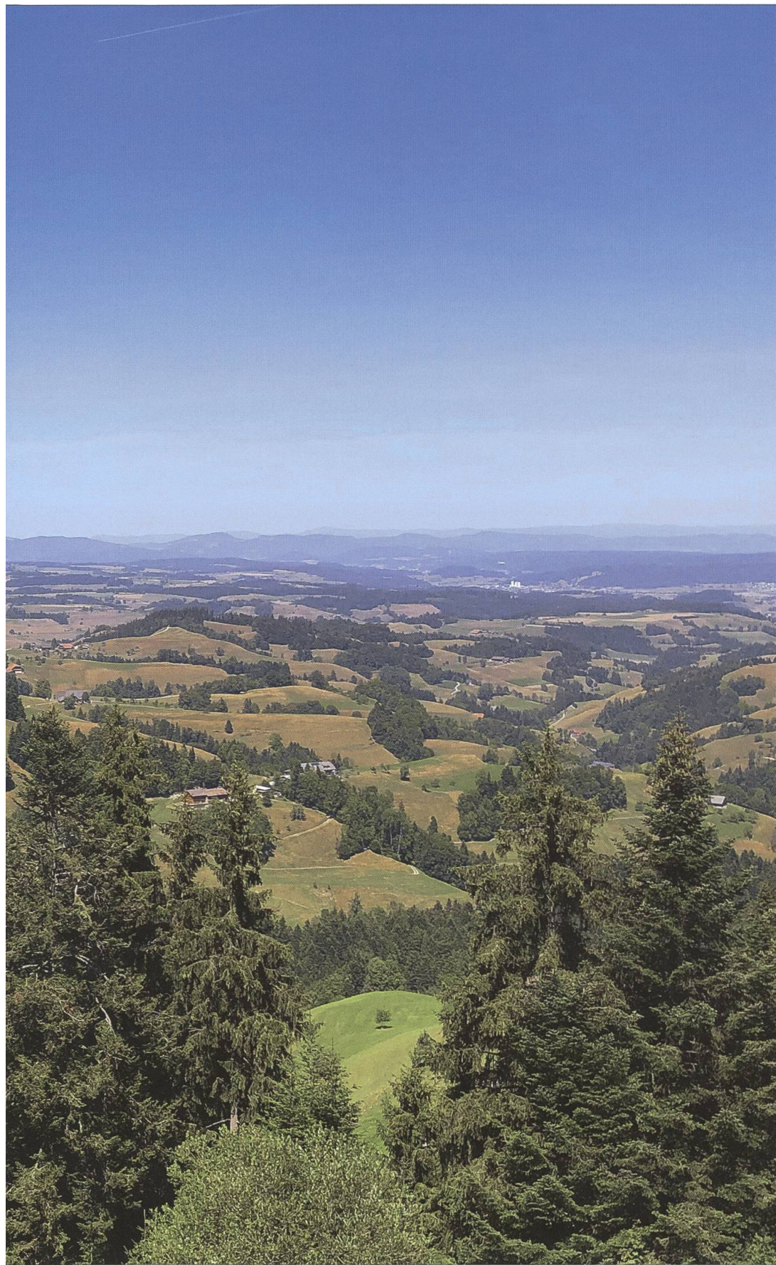
Blick vom Oberlehn (Menzberg) auf das Luzerner Hinterland.