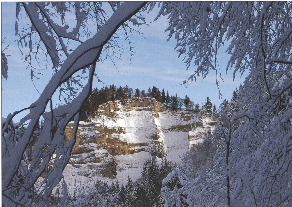
Der Hengst beim Napf.