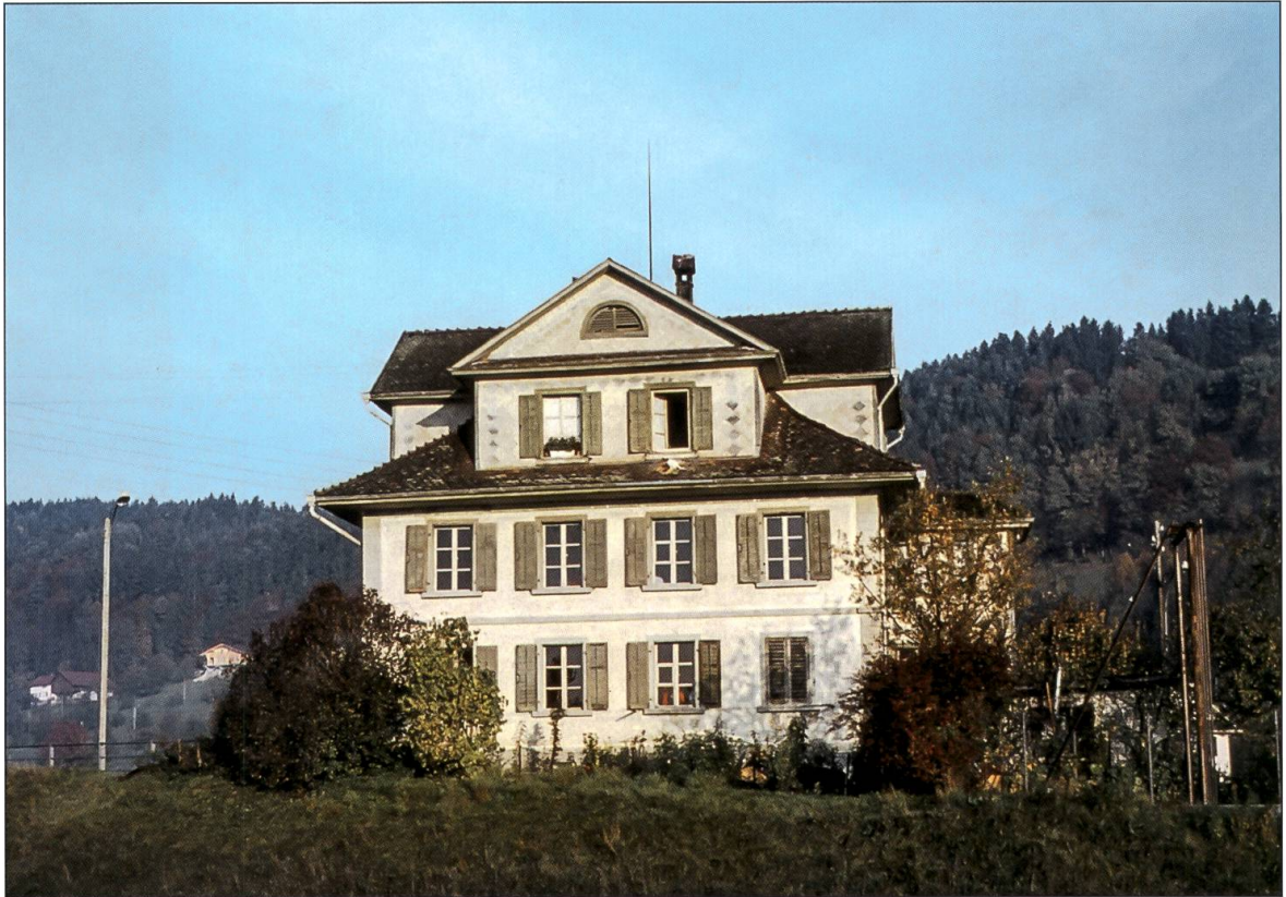
Das Egolzwiler Schulhaus von 1836 bis 1976.