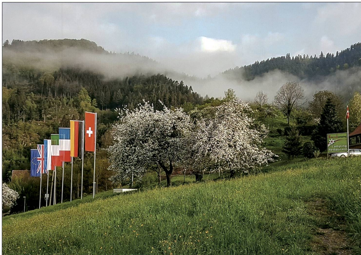
Bilder der neuen Heimat von Priska und Vinzenz Blum im Schwarzwald, Deutschland.