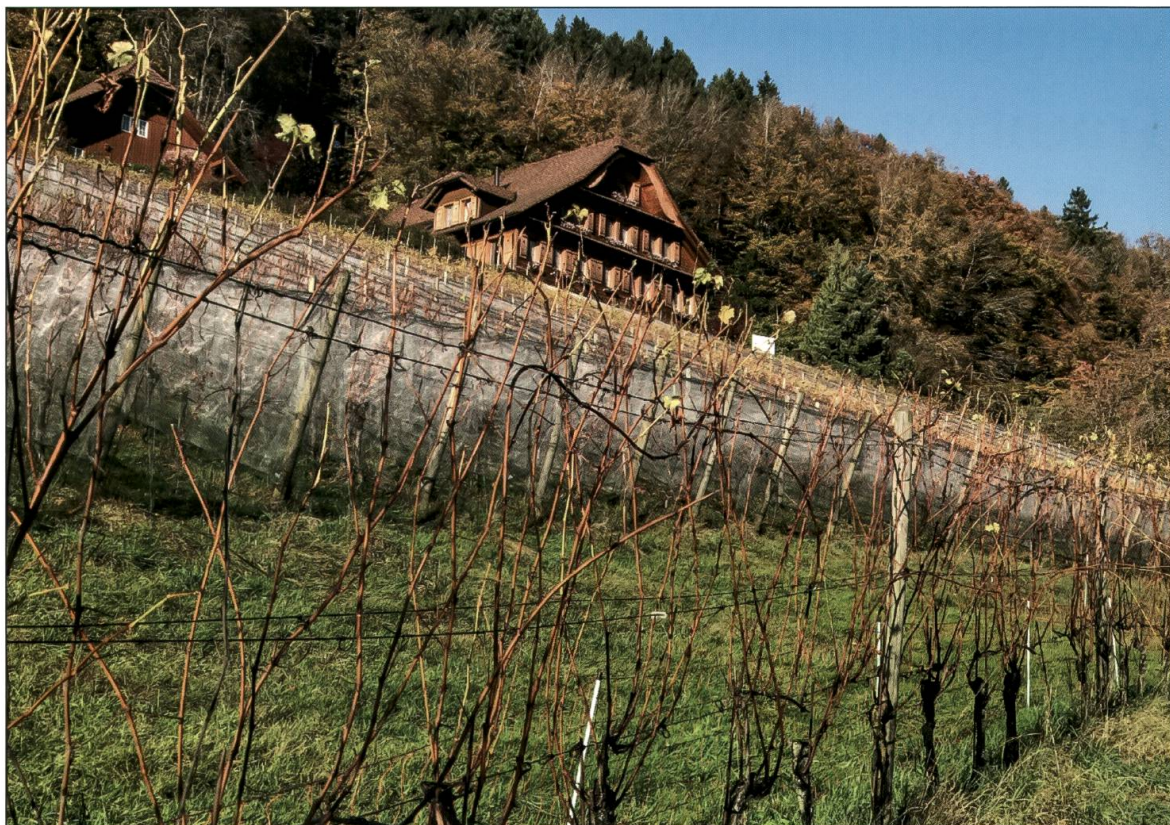
Der Hof Aengelberg über Egolzwil.