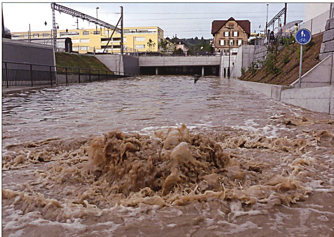
Die im November 2015 eröffnete Unterführung an der Strengelbacherstrasse in Zofingen lief innert kurzer Zeit voll.

schutz und ein Löschzug der SBB. Am Sonntag arbeiteten rund 120 Einsatzkräfte mit Hochdruck daran, die überschwemmten Unterführungen für den Verkehr passierbar zu machen, Keller auszupumpen und die Stromversorgung sicherzustellen. Einzelne Quartiere waren auch am Sonntagabend noch ohne Strom. «In gewissen Liegenschaften sind die Elektroinstallationen noch unter Wasser», sagte Kommandant Ruch am Montag. Die Einschaltung konnte erst erfolgen, nachdem die Gebiete von der Feuerwehr und den Städtischen Werken freigegeben waren.