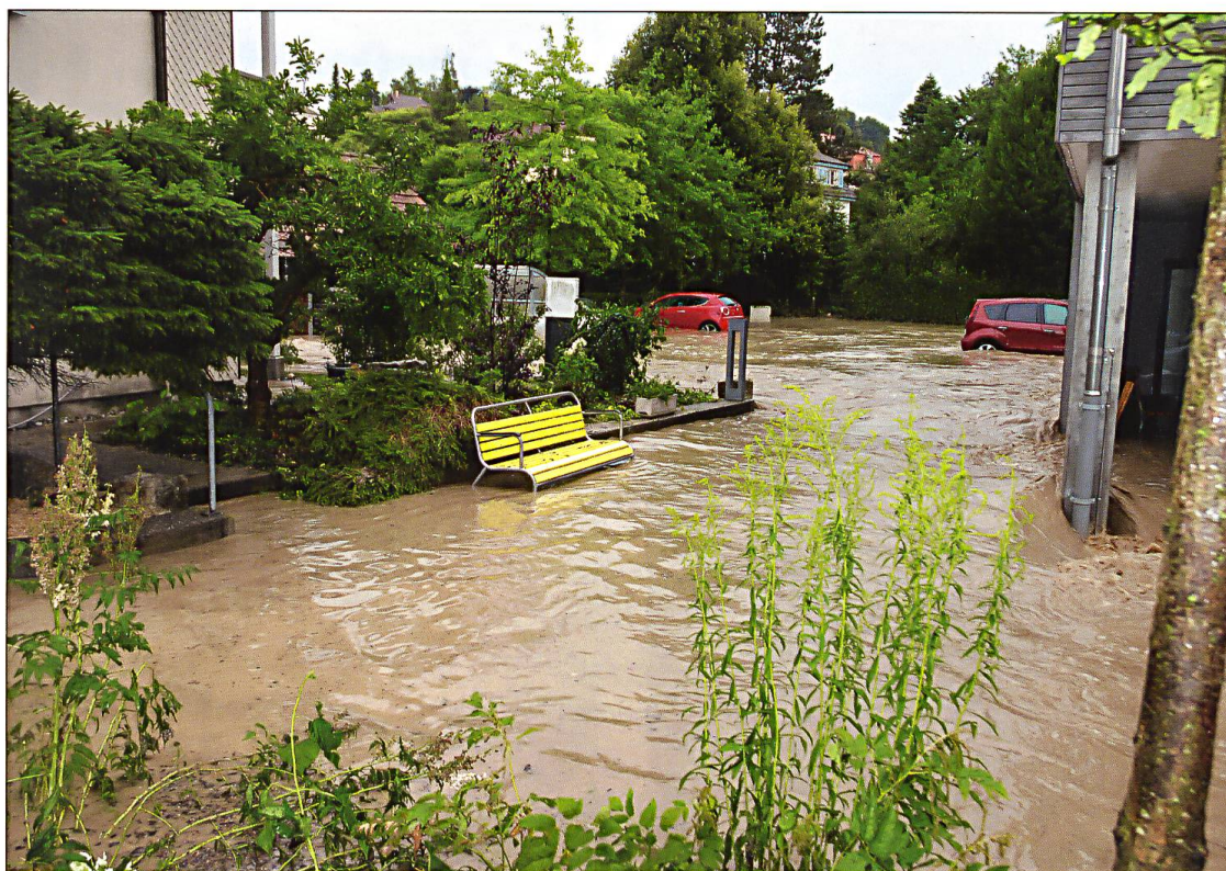
Beim Alterszentrum Blumenheim. Dieses wurde von den Zofinger Alterszentren am stärksten in Mitleidenschaft gezogen.

Unwetter beeinträchtigte überdies den Verkehr. Die A1 bei Oftringen war überflutet, sodass der Verkehr in beiden Richtungen vorübergehend zum Erliegen kam. In Zofingen standen zudem am Samstagabend zwei Gleise unter Wasser.