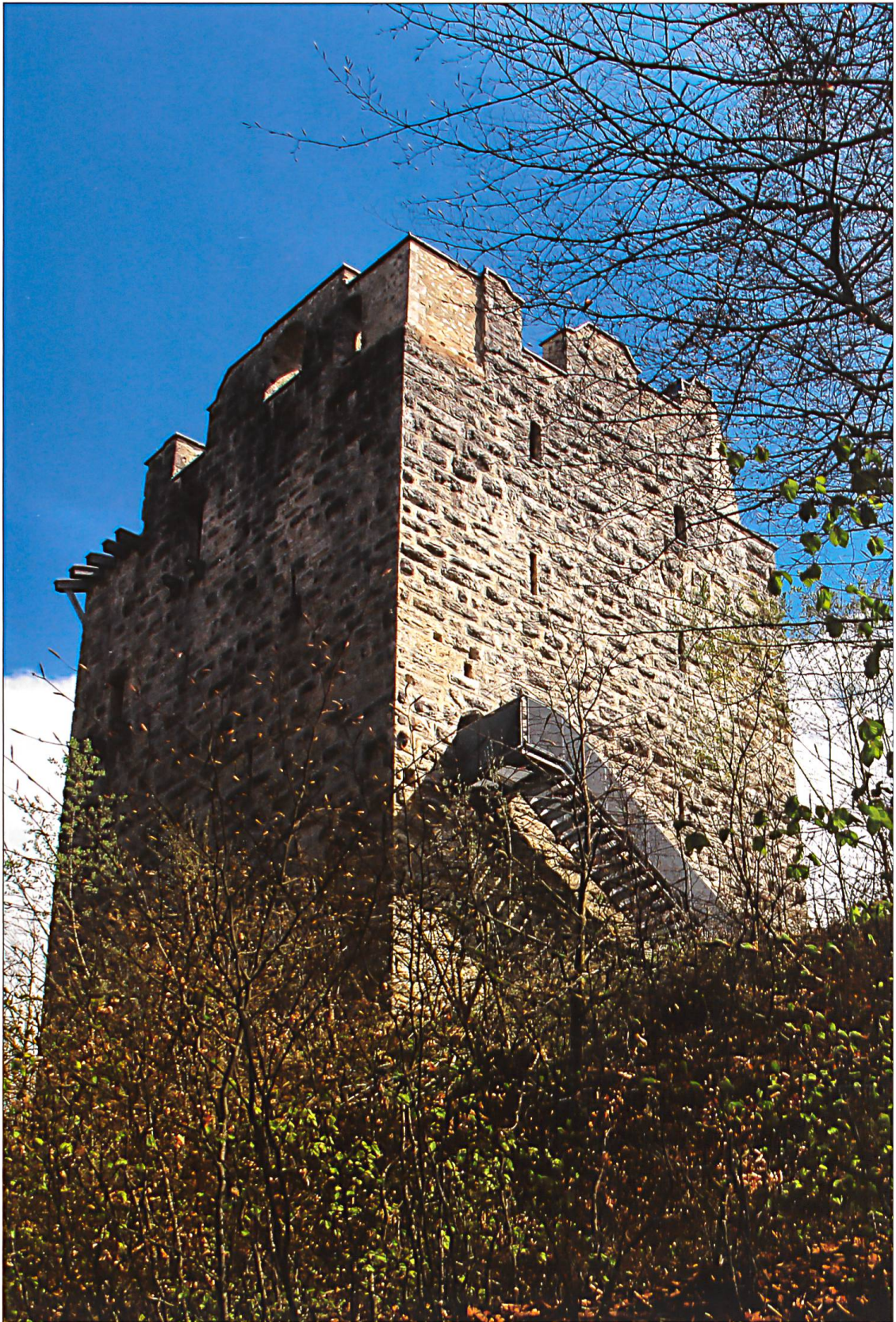
Kastelen, wichtiger Adelssitz der Kyburger aus dem Jahr 1252.