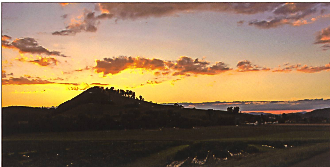
Magischer Kastelenhügel in der Abenddämmerung.