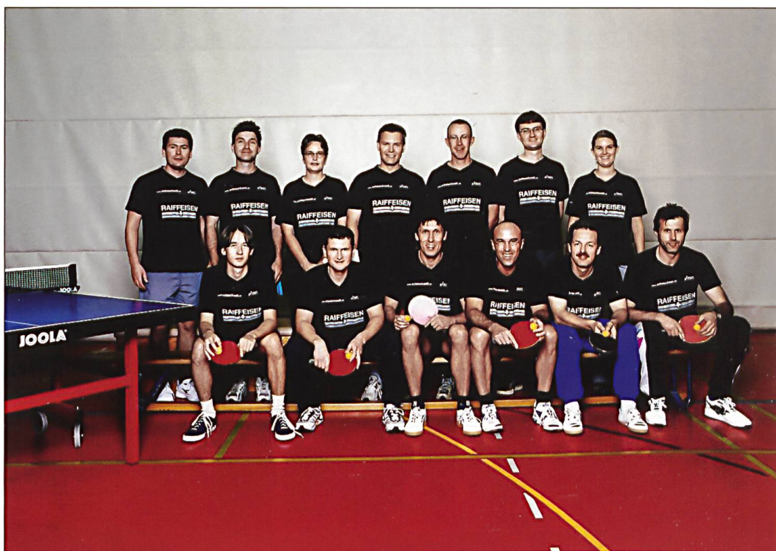
Die Aktiven des TTC Willisau im Jahr 2000...