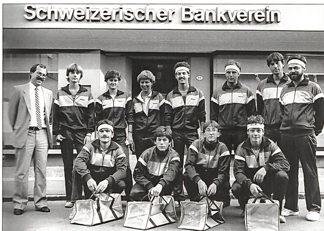
Die Aktiven des TTC Willisau mit neuem Hauptsponsor 1985.