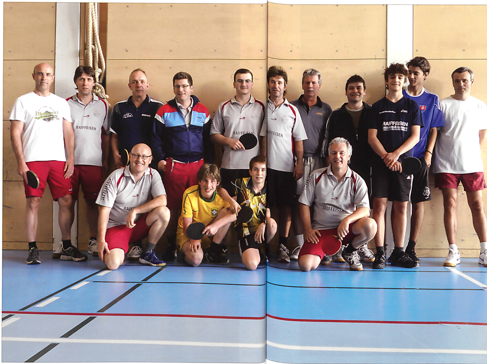
TTC Willisau 2013.